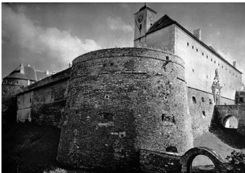
Zámok Červený Kameň

V našom príspevku sme sa sústredili na stručné zhrnutie špecifických podmienok, ktoré determinujú provenienčný výskum rodových šľachtických knižníc na Slovensku. Vychádzali sme pritom z osobných skúseností získaných dlhoročným, stále prebehajúcim výskumom rodovej knižnice Pálfičov. Naš výskum potvrdil potrebu viacúrovňového prístupu k skúmaniu vlastníckych vzťahov v rámci rodových knižníc, ktorý vzájomne prepája dostupné poznatky z dejín šľachtických rodov a dejín súkromných knižníc. Takto realizovaný výskum nám objasní spôsobom budovania rodovej knižnice a umožní jej rekonštrukciu. Dúfame, že uvedením konkrétnych príkladov vlastníckych záznamov pomôžeme identifikovať palfiovské knihy zachované mimo doteraz známych miest uloženia.