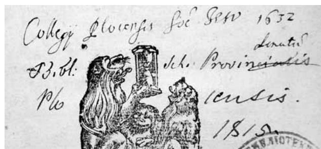
A handwritten note by the Jesuits in Plock from the 17 th century and by Schola Plocensis from the 19 th century. BUW Sd.608.2054

According to an outline prepared in the Early Printed Books Department, the main entry consists of the following parts: 1) the history of the library, 2) images and 3) sources. The first item contains, among others, variant forms of the name of the library used in provenance marks and notes, and a concise history of the library (the various stages of its