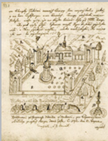
Z rukopisných Pamětí F. J. Vaváka (Národní muzeum)

Ves Milčice a největší z českých selských písmáků František Jan Vavák jsou synonyma, vyjadřující spojení českých venkovských lidí se zemí, kde se narodili, s půdou, na níž hospodařili, a s kulturou jazyka, jímž mluvili. Z tohoto podhoubí vyrůstalo na přelomu 18. a 19. století národní hnutí ovlivněné na jedné straně českou barokní zbožností a povědomím historické tradice, ve které se mísily zdánlivě nesourodé prvky katolické víry s výsledky české náboženské reformace, na druhé straně náročnými, neúnavnými a krok za krokem pracně postupujícími aktivitami buditelů tří generací. Ve výjimečných případech se buditelův program obnovy českého národního života, nesený povytce intelektuály, prolínal s cílevědomostí a intenzivním sebevzděláváním příslušníků selského stavu. Vavák jistě nebyl jediný sedlák, který stál v jedné řadě s buditelůvými iniciátory, ale z těch několika byl nejvzdělanější, nejsamostatnější v uvažování a nabyl nejširšího vlivu. Lze říci, že milčický rychtář byl jediný český písmák, který měl rysy geniality.