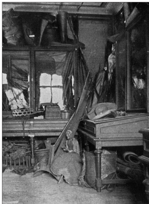
Obrázek 1 – Přeplněný interiér a často ohrožené sbírky – to byl jeden z výsledků německé správy v muzeu.

S postupně se zhoršující situací na frontách se přirostřovaly i poměry v zázemí. Akutním nebezpečím se staly možné spojenecké nálety, a proto bylo přistoupeno k evakuaci sbírek nebo k jejich zabezpečení ve sklepení muzea, upraveném na protiletadlový kryt. Stěhování sbírek přineslo další obtíže – často bylo prováděno ve spěchu a do nevhodných prostor, ohrožujících samu fyzickou podstatu jednotlivých předmětů. Stejně tak panovaly obavy, aby německá správa nevyužila stěhování k vyvezení nejvzácnějších kusů pro potřebu říšskoněmeckých muzeí. Na jaře roku 1945 se muzeum nacházelo ve složité situaci. Jeho odborný program prakticky zanikl a část sbírek byla vystěhována mimo Prahu. Exponáty z přízemí a z 1. patra se přesouvaly do muzejního krytu. 12 Jak ovšem konstatovala zpráva popisující květnové události roku 1945 v Náprstkově muzeu: „Tyto práce byly přerušeny v dopoledních hodinách památné soboty dne 5. května, kdy začala revoluce...“ 13 – muzeum se rázem