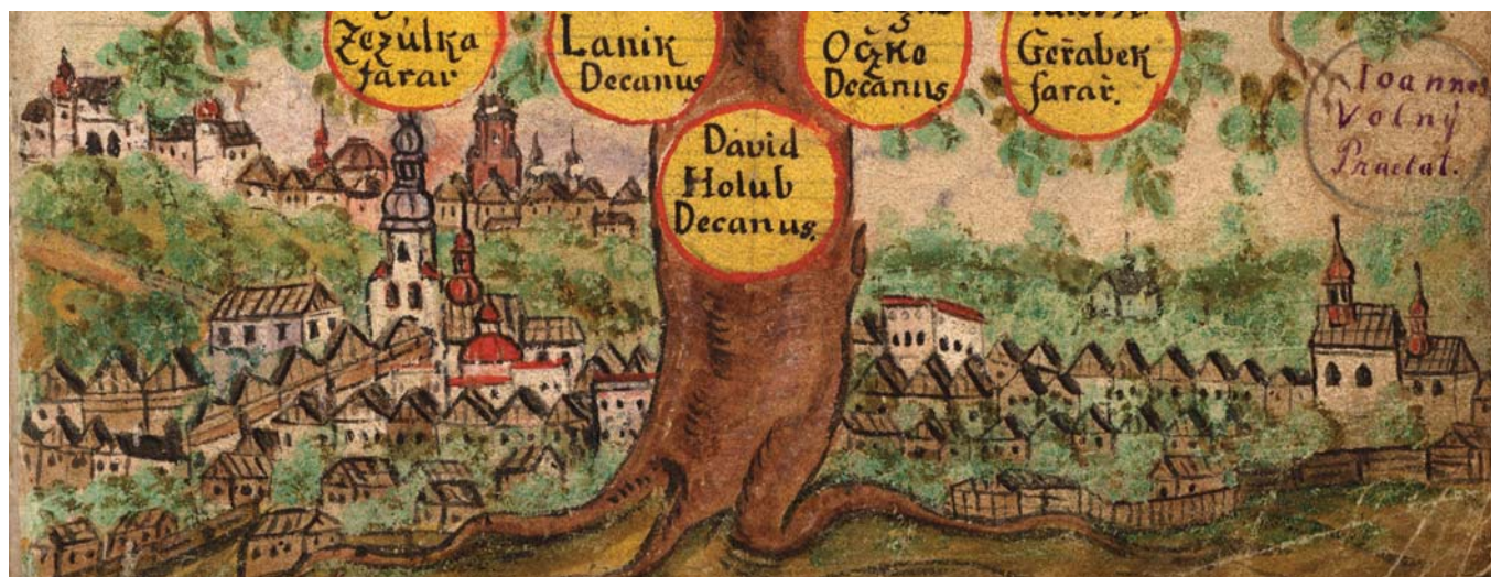
Obr. 1. Veduta města Místku – v zadní části vyobrazen Frýdek, 1746 (Státní okresní archiv Frýdek-Místek, fond Cech soukenický Místek).

řádu se příborské gymnázium potýkalo s nedostatkem kvalitních učitelů i rádoých bratří, měnový krach v roce 1811 způsobil znehodnocení úspor v nadacích, které financovaly chod školy. Rovněž dotace ze strany města přestávaly stačit. Finanční obtíže nakonec vedly ke zrušení piaristického gymnázia v Příboře v roce 1829, definitivně toto rozhodnutí potvrdilo nařízení moravského gubernia ze dne 28. května 1832. 6