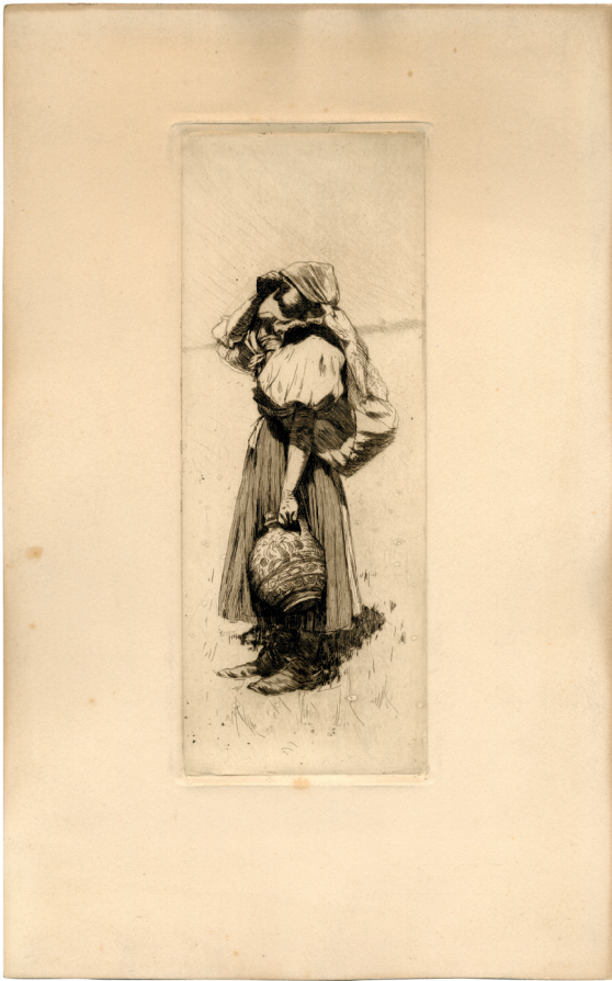
Obr. 1. Žena se džbánem v ruce. Vrbovčanka (přelom 18. a 19. století). Perokresba. Zdroj: Etnografický ústav MZM, podsběrka Etnografická, fond grafiky a výtvarných prací, inv. číslo G1911; autor: Joža Uprka.

Díky výzkumu v letech 2022 až 2024 se podařilo dohledat nové informace k jednomu ze čtyř autorů konvolutu kvašů z roku 1814, představiteli josefínského osvícenství, ale i katolického preromantismu, Josefa Heřmana Agapita Gallaše. Gallaš byl v říjnu roku 1781 (ve svých 25 letech) zapsán jako řádný student na Vídeňské malířské akademii. 5 Ačkoliv se zatím nepodařilo zjistit, jak dlouho na akademii studoval a zda ji dokončil, z hlediska historie umění tato skutečnost Gallaše nově řadí jako výše postaveného umělce. Fond grafiky a výtvarných prací byl navíc impulzem pro dohledání veškerých Gallašových výtvarných prací, a tak v roce 2024 vydalo Moravské zemské muzeum publikaci s názvem Víc, než by se zdálo. Výtvarné práce Josefa Heřmana Agapita Gallaše a jejich význam v současnosti . 6 Dnes již díky výzkumu malířského profilu Gallaše víme, že se zachovalo jen několik jeho olejomalb a výtvarných prací většího formátu, i proto představuje jeho 21 kvašů z podsběrky Etnografické vzácnou kulturně-historickou památku, ke které se doposud přistupovalo výhradně v kontextu vzácného pramenu pro studia oděvu.