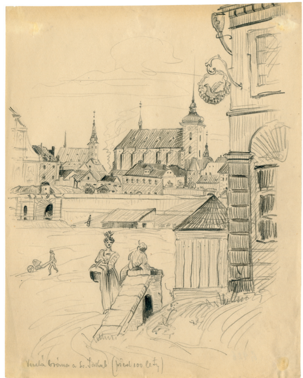
Obr. 2. Veselá brána a svatý Jakub (před 100 lety) (ca 1928). Kresba tužkou na tenkém papíře. Zdroj: Etnografický ústav MZM, podsběrka Etnografická, fond grafiky a výtvarných prací, inv. číslo G926; autor: Josef Grus.

představují studie zahrnující celou škálu námětů z okruhu tradiční lidové kultury, jeho zájem se obecně koncentruje především na rurální (venkovské) prostředí, ale výjimkou nejsou ani kresby z městského prostředí. Grusova originální autorská díla tvoří vzhledem k použité technice zpracování nejčastěji kresby tuší a tužkou a několik málo akvarelů. Ačkoliv se jeho zájem koncentroval na první třetinu 20. století, je ve fondu uložen i Grusův soubor 22 kreseb tužkou podle dobových maleb Brna okolo roku 1828. Využití této kolekce, která teprve čeká na hlubší prozkoumání, spočívá v historické rekonstrukci brněnských veřejných míst a památek. Z první poloviny 19. století se dochovala většinou panoramatická vyobrazení měst, případně krajinných rázů (CHATRNÝ, 2025), i proto je menší kolekce svým tematickým zaměřením hodnotná, byť se jedná o kresby podle předlohy.