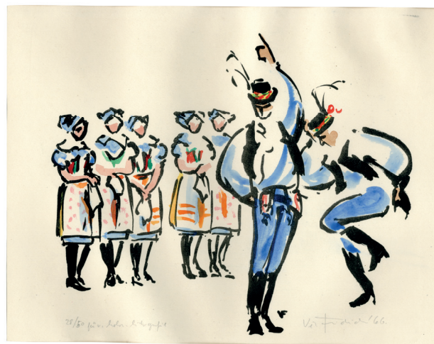
Obř. 3. Hornácký verbuňk. Kombinovaná kresba tuší a akvarelem. Zdroj: Etnografický ústav MZM, podsbírka Etnografická, fond grafiky a výtvarných prací, inv. číslo G1904; autorka: Věra Fridrichová.

Dílo Fridrichové je jedním z mála, které má studijní charakter pro tematické celky nehmotného kulturního dědictví, v tomto případě lidového tance. Etnologie a především její poměrně malé odvětví – etnochoreologie využívá studijních nákresů kroků jednotlivých tanců pro lepší pochopení choreografií, výtvarné práce mohou pro svou kvalitu zpracování a detail sloužit k pokročilejším rekonstrukcím. Nehledě na to, představuje osobnost výtvarnice významnou součást psaní historie tance a divadla v Československu, ve které očividně lidový tanec hraje nepostradatelnou roli.