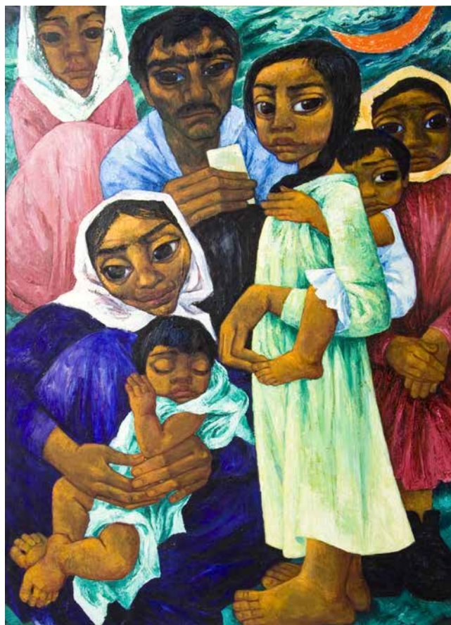
Obr. 8. Míla Doleželová, Cikánská rodina s měsícem, 70. léta, olej na plátně, 140 x 99 cm. Sbíрка Muzea romské kultury, MRK 627/08