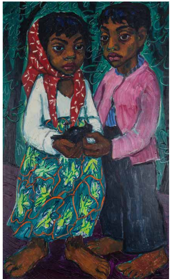
Obr. 13. Míla Doleželová, bez názvu, neznámá datace, olejomalba na dřevěné desce. Sbíрка Muzea romské kultury, MRK 42/20.