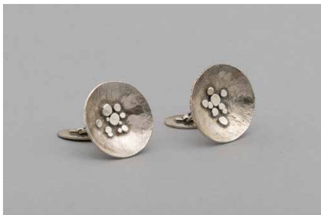
Obr. 5. Rosa Taikon, manžetové knoflíky, stříbro, 1972. Sbíрка Muzea romské kultury, MRK 310/17.

K nejzajímavějším předmětům z fondu patří stříbrné manžetové knoflíky, které vyrobila známá švédská šperkařka Rosa Taikon (1926–2017) z romské subetnické skupiny Kalderašů. Kalderaši byli v minulosti známí kovotepci, a i když se řemeslo zpravidla dědilo z otce na syna, tak v rodině Taikon po bratrově tragické smrti tradici převzala nejstarší dcera Rosa. Její dílo čerpá z tradičních romských motivů, nejčastěji používá techniku filigránu (splétání tenkých stříbrných drátů do požadovaného tvaru) nebo granulace (nanášení drobných kuliček na tepaný podklad). Uvedené manžetové knoflíky vytvořila Rosa společně s manželem Berndem Januschem v roce 1972. Muzeum je získalo v roce 2017. Dílo R. Taikon je zastoupeno ve sbírkách řady muzeí nejen v Evropě (Švédsko, Finsko, Norsko, Velká Británie, Německo), ale i v USA či Austrálii. R. Taikon patřila mj. i k výrazným postavám romského etnoemancipačního hnutí. 3