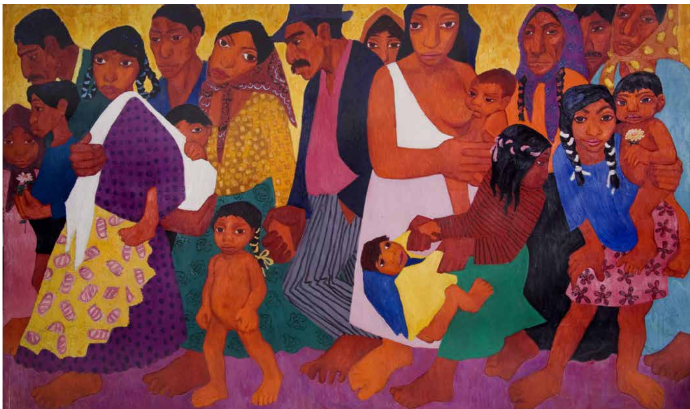
Obr. 9. Míla Doleželová, Na cestě, poč. 60. let, olej na plátně, 180 x 300 cm. Sbíрка Muzea romské kultury. MRK 1/2005/7.