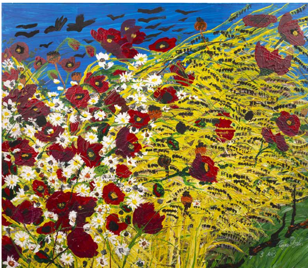
Obr. 17. Ceija Stojka, Vlčí máky, 2003, olej na plátně, 60 x 70 cm. Sbíрка Muzea romské kultury, MRK 37/2005/4.