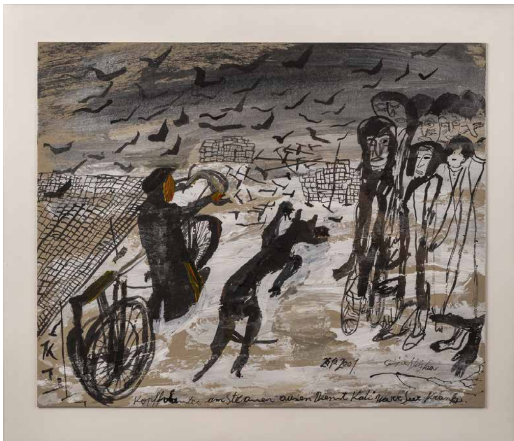
Obr. 16. Ceija Stojka, Strach, 2001, akvarel na lepence, 34,3 x 42,3 cm. Sbíрка Muzea romské kultury, MRK 37/2005/1.