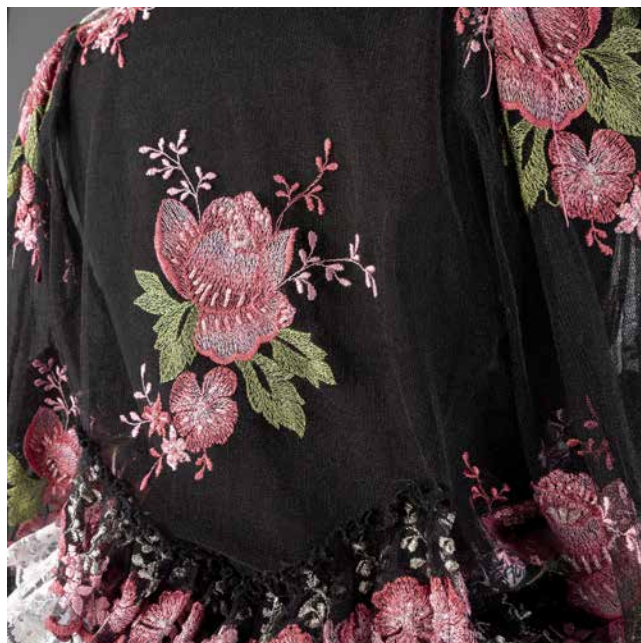
Obr. 1–4. Sváteční oděv ženy ze skupiny Kale (Finsko), 90. léta 20. století. Sběrka Muzea romské kultury, MRK 261/15.