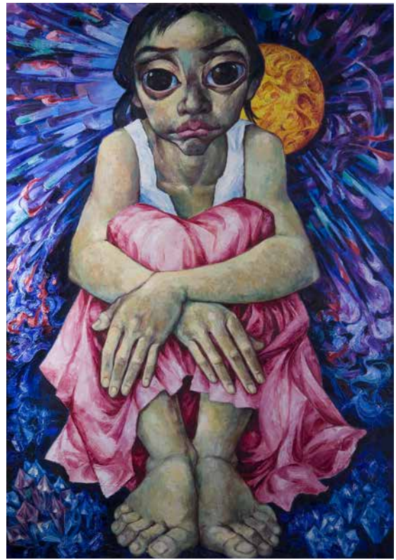
Obr. 11. Míla Doleželová, Zamyšlená, 1980, olejomalba na plátně, 135 x 96 cm. Sbíрка Muzea romské kultury, MRK 267/10.