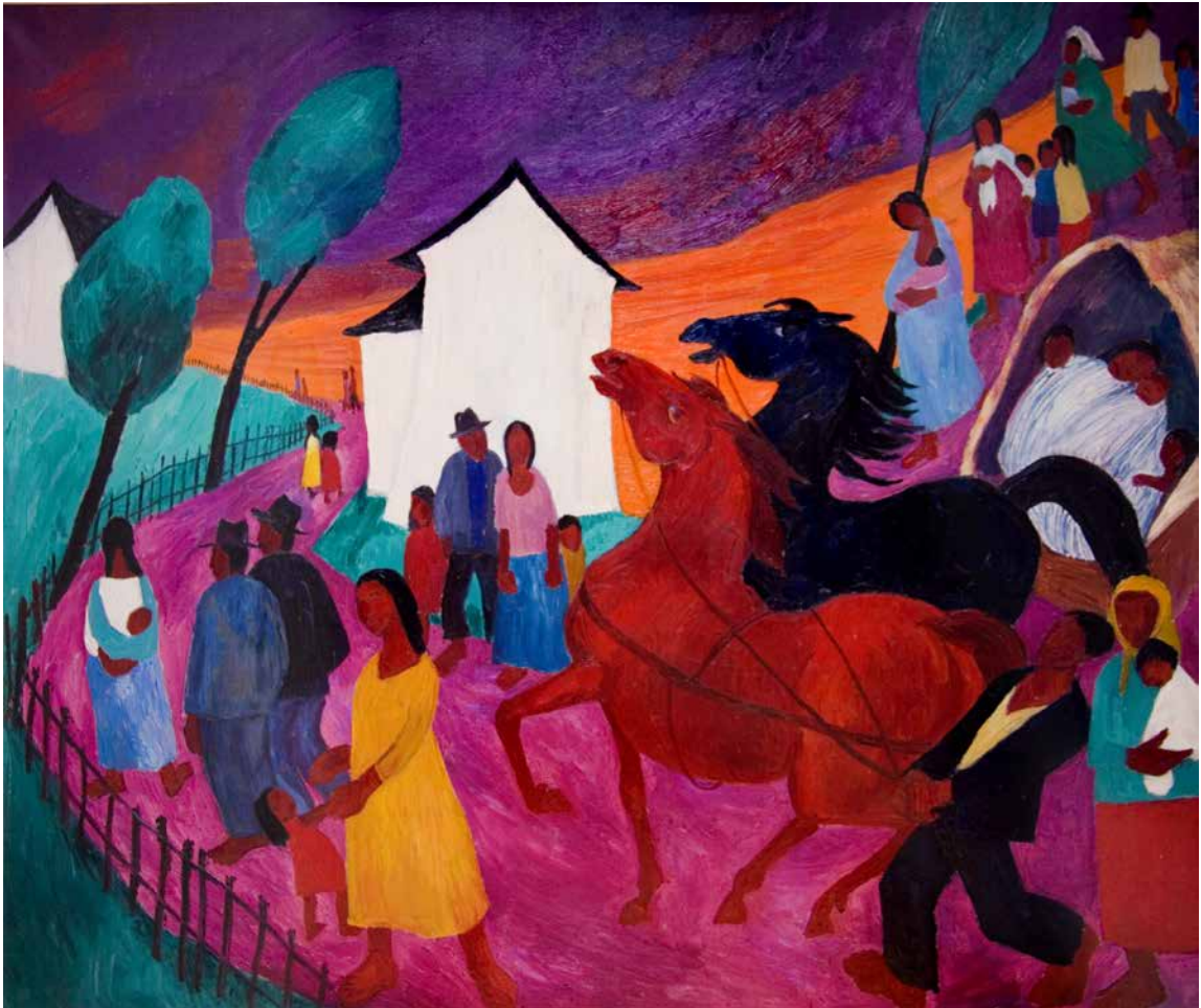
Obr. 14. Míla Doleželová, Putování, 50. léta, olej na plátně, 147,5 x 173,5 cm. Sbíрка Muzea romské kultury, MRK 329/10.