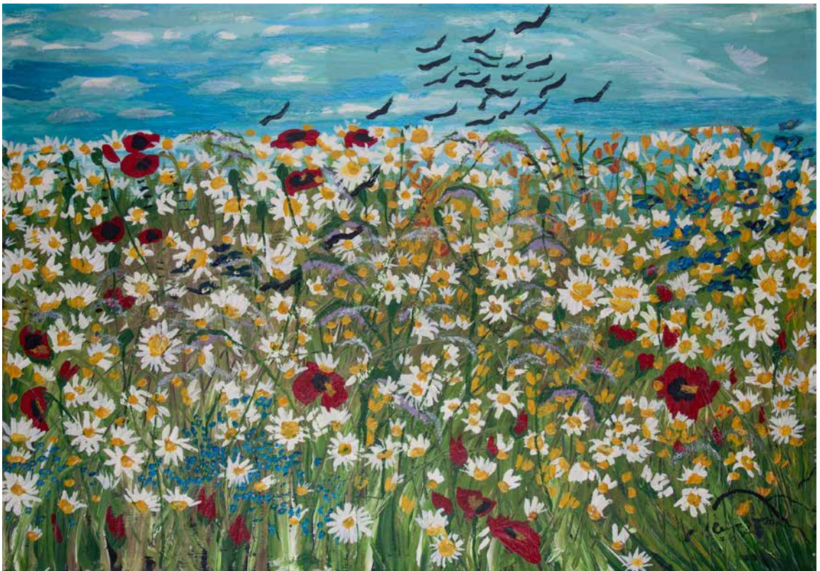
Obr. 15. Cejja Stojka, bez názvu (Kopretiny s vlčími máky), patrně 1971, olej na lepence, 73 x 102,5 cm. Sbíрка Muzea romské kultury, MRK 43/2020.