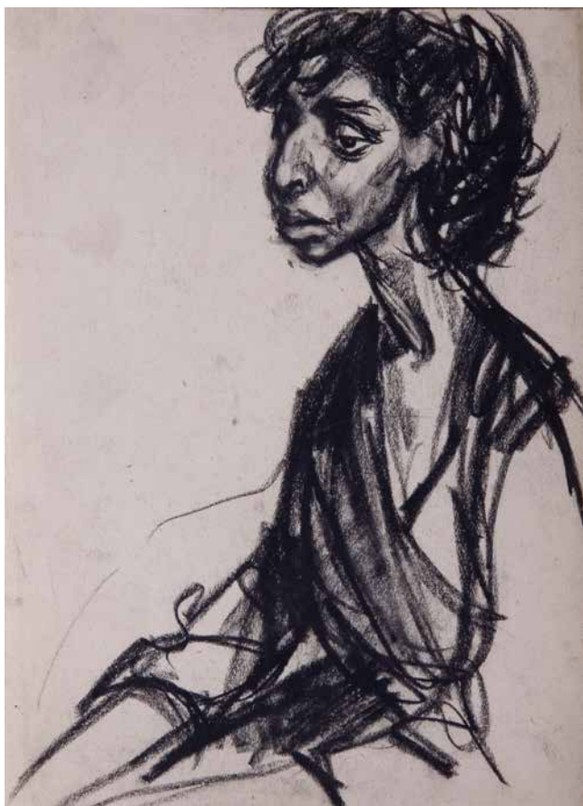
Obr. 7. Míla Doleželová, Sedící žena, 50. léta, uhel na papíře, 29,4 x 21 cm. Sbíрка Muzea romské kultury, MRK 374/06/31.