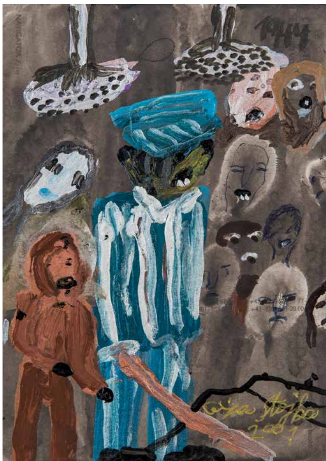
Obr. 18. Ceija Stojka, Kápo, 2001, kombinovaná technika na kartonu (formát pohlednice), 14,8 x 11,5 cm. Sbíрка Muzea romské kultury, MRK 38/2005/2.

roviny – traumatické vzpomínky na holokaust a idylické krajiny plné květů a letících ptáků. Oba motivy jsou ve sbírce muzea zastoupeny (celkem 12 děl), např. akvarel „Strach“ nebo „Kápo“ či olejomalby „Vlčí máky“ či „Kopretiny s vlčími máky“. Vzpomínky na holokaust zachytila i v autobiografii Wir leben im Verborgenen / Žijeme ve skrytu. Vyprávění rakouské Romky . 5 Kresby a malby C. Stojky jsou k vidění v muzeích v Evropě, USA i Japonsku.