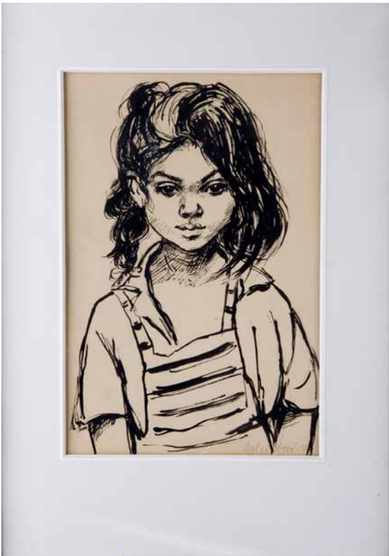
Obr. 10. Míla Doleželová, Cikánské děvčátko, 1954, tuš na papíře, 17 x 11, 5 cm. Sbíрка Muzea romské kultury, MRK 204/09.