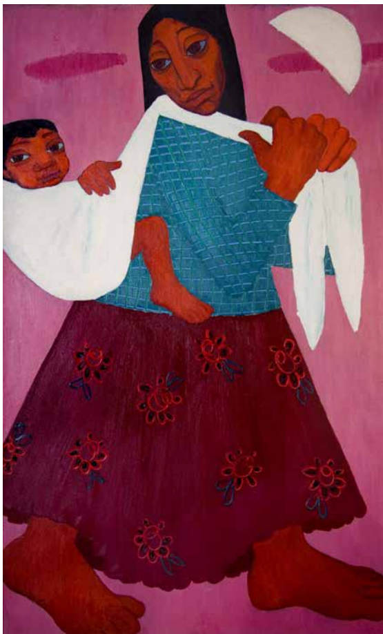
Obr. 12. Míla Doleželová, Matka s dítětem v loktuši, po roce 1960, olej na plátně, 197 x 121,5 cm. Sbíрка Muzea romské kultury, MRK 328/10.