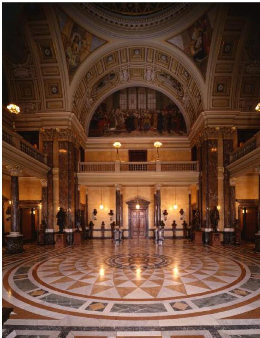
Panteon Národního muzea.

zim 2019 a zbylých, společenskovedních v polovině roku 2020. Konzultantem pro výběr architektů a jistý scelující přístup k expozičním se stal architekt Josef Pleškot. Národní muzeum zároveň předpokládá vypsání samostatné soutěže na grafické studio, které by mělo následně spolupracovat s architekty na výtvarné podobě budoucích stálých expozičních. Samostatným tématem pak bude příprava audiovizuálních a multimediálních částí nových expozičních.