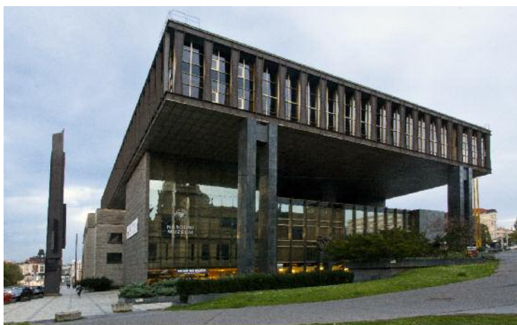
Nová budova Národního muzea.

v mořích až k savcům; ExperiMus – původně idea prezentace vývoje planety postupně transformovaná do originálního výstavního pokusu o skutečně experimentální