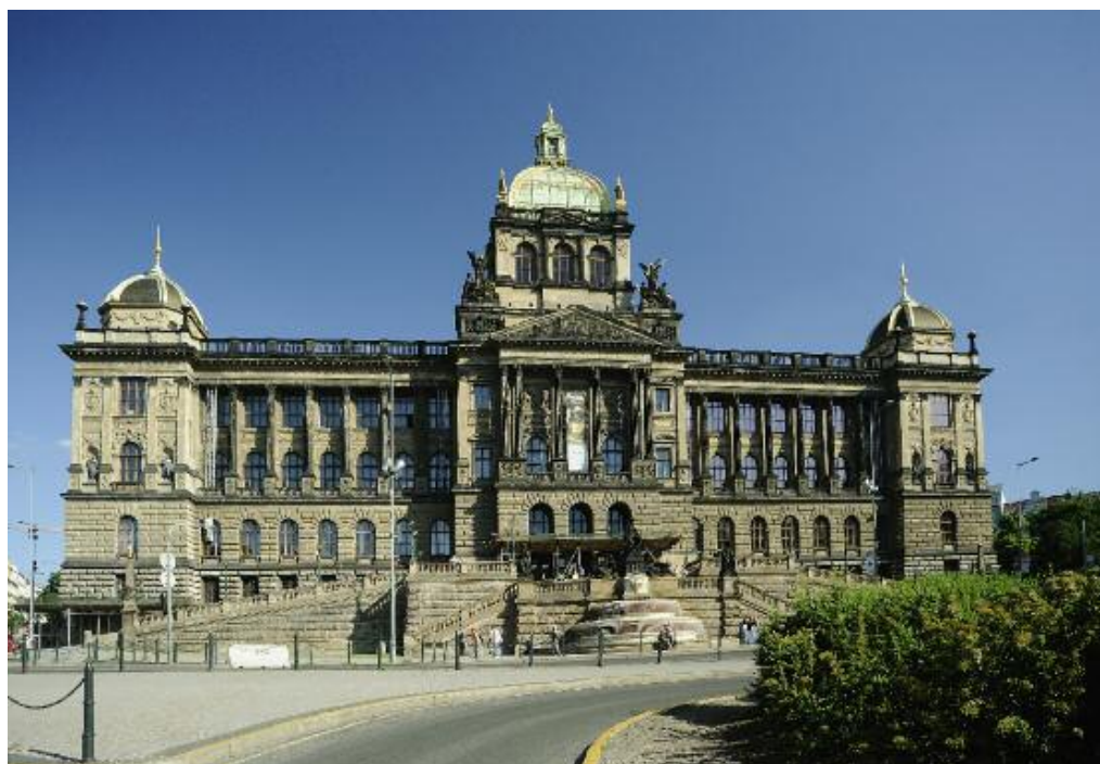
Historická budova Národního muzea.

jednak tematické rozdělení do tří přístupů – příroda kolem nás – prezentace vývoje přírody od prvohor k dnešku; – příběhy evoluce – seznámení s počátky života