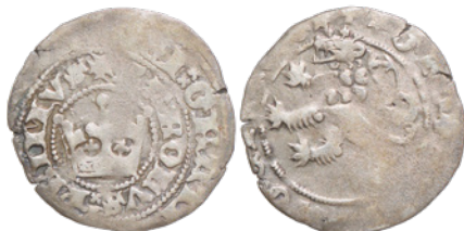
22. 2,908 g; 27,4 mm (nr inw. 3245/22)