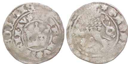
18. 2,933 g; 27,5 mm; rewers bity podwójnie (nr inw. 3245/13)