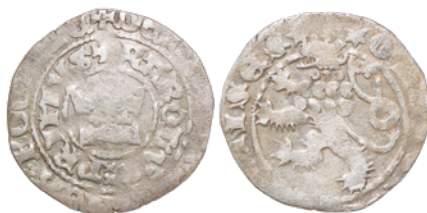
21. 2,694 g; 27,6 mm; lew V.c odm. 1 (nr inw. 3245/21)