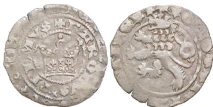
15. 3,200 g; 27,3 mm; rewers bity podwójnie; lew V.c odm. 1 (nr inw. 3245/9)