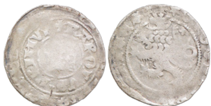
17. 2,885 g; 27,8 mm; lew V.c odm. 2 (nr inw. 3245/12)