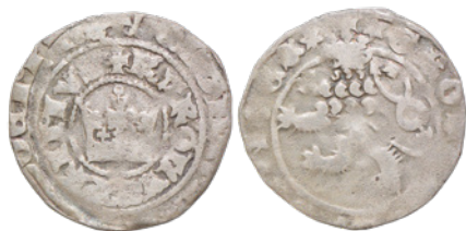
19. 3,022 g; 28,4 mm; lew V.c odm. 2 (nr inw. 3245/14)