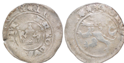
9. 2,999 g; 27,4 mm; awers bity podwójnie (nr inw. 3245/24)