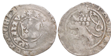
16. 2,685 g; 27,3 mm (nr inw. 3245/11)