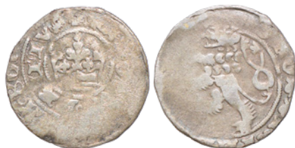
7. 2,960 g; 26,1 mm; awers bity podwójnie (nr inw. 3245/18)