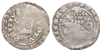
20. 2,717 g; 28,2 mm; lew V.c odm. 1 (nr inw. 3245/19)