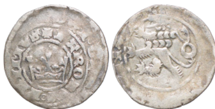
8. 2,847 g; 27,2 mm (nr inw. 3245/20)