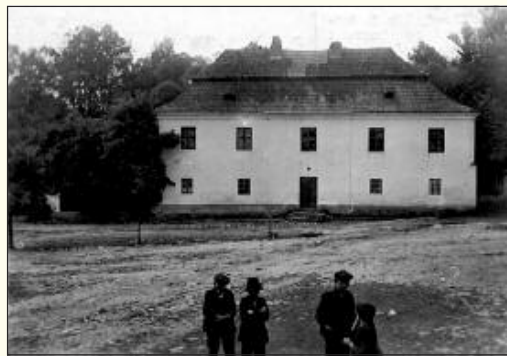
Dobová pohlednice fary (1914)