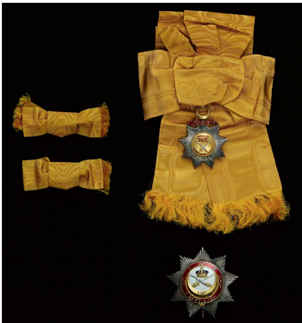
Obr. 2. Dochované součásti Nejvznešenějšího řádu johorské královské rodiny z vlastnictví Františka Ferdinanda d'Este uloženého ve sbírce Národního muzea.

Etuje o rozměrech 41 × 34 cm a výšce 9,2 cm je potažena tmavě modrým sametem. Vnější plochu víka zdobí zlacené kování: uprostřed koruna sultanátu Johor s překříženým mečem a krisem ovázanými páskou s nápisem Kepada Allah Berserah