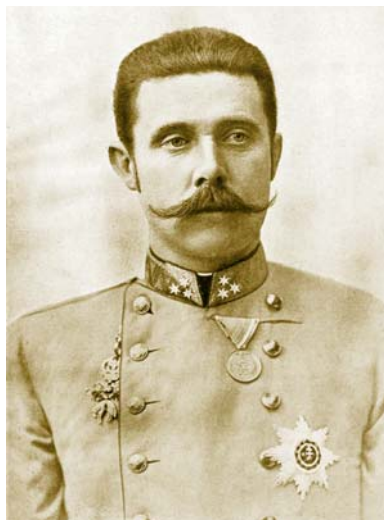
Obr. 1. Arcivévoda František Ferdinand d'Este s Řádem zlatého rouna a oběma rakouskými dekoracemi vztahujícími se k jeho cestě kolem světa – hvězdou velkokříže Královského uherského řádu sv. Štěpána a Pamětní medailí na mořskou plavbu 1892–1893.

Hned po návratu, 27. října 1893, odsouhlasil císař Františku Ferdinandovi přijetí a nošení japonského Nejvyššího řádu chryzantémy, který arcivévoda obdržel od japonského císaře Mucuhita v době své návštěvy v Tokiu, 8 úspěšné vykonání cesty kolem světa ohodnotil pak František Josef I. udělením nejvyššího rakouského státního nevojenského vyznamenání, velkokříže Královského uherského řádu sv. Štěpána 9. listopadu 1893. S arcivévodovou cestou souvisí i o dva dny později udělená Pamětní medaile na mořskou plavbu 1892–1893, kterou následně obdrželi i všichni další účastníci plavby křižníku Kaiserin Elisabeth, který se v prosinci 1893 vrátil do přístavu v Pule. K těmto třem dekoracím přímo spjatým s cestou kolem světa lze nově s jistotou přiřadit i Nejvznešenější řád johorské královské rodiny udělený Františku Ferdinandovi vládcem malajského sultanátu Johor Abu Bakarem. Kolem udělení johorského řádu panují v dosavadní literatuře určité pochyby a nesrovnalosti. Nedochoval se totiž císařův schvalující dopis a ve dvorní příručce se řád v titulatuře Františka Ferdinanda objevuje až v roce 1905, navíc zaměněný za jinou, nižší johorskou dekoraci. Na základě tohoto mylného údaje je proto Františku Ferdinandovi ve všech dosavadních publikovaných materiálech i internetových zdrojích přisuzován Řád johorské koruny. 9