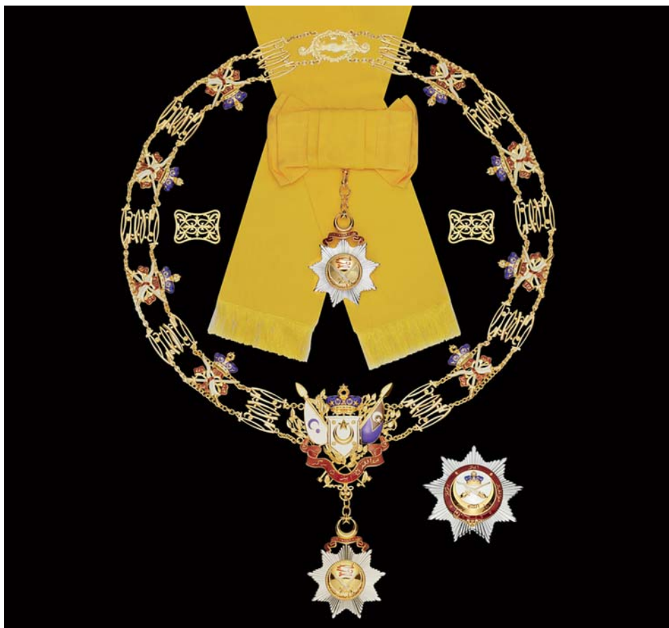
Obr. 7. Dnešní podoba kompletních insignií I. třídy Nejvznešenějšího řádu johorské královské rodiny s kolanou.

Kolana se do sbírek Národního muzea nedostala, lze ji tedy popsat pouze obecně (kompletní řád i s kolanou v podobě, v jaké je dnes udělován, zachycuje obr. 7). Je tvořena střídajícími se dvěma druhy článků – stylizovanými znaky jména zakladatele řádu sultána Abu Bakara a korunou sultanátu Johor nesenou překříženým mečem (zprava) a krisem (zleva), které obepíná červená páska s nápisem Allah Berserah (Podrobně se Alláhovi). Na kolaně zavěšený klenot tvoří znak sultanátu Johor, na bílém poli pěticípá hvězda mezi rohy stoupajícího půlměsíce, okolo čtyři pěticípé hvězdy, vše zlaté, nahoře nesoucí korunu sultanátu. Vpravo znak doprovází standarda sultána, v bílém poli uprostřed modrý ubývající měsíc a devíticípá hvězda, vlevo státní standarda, v modrém poli červený kanton s bílým ubývajícím měsícem a pěticípou hvězdou. Dole klenot doplňují ratolesti a červená páska s řádovým heslem Muafakat itu berkat (Svornost je požehnání).