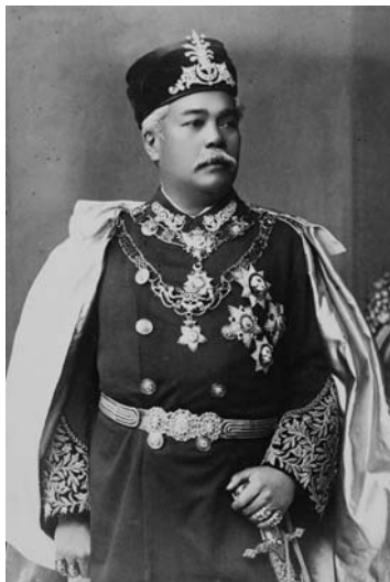
Obr. 9. Sultán Abu Bakar s kolanami a hvězdami obou nejvyšších johorských řádů.

Abu Bakar (obr. 9) se narodil patrně roku 1830 v Teluk Belanga v Singapuru, od roku 1819 ovládaném Brity, jako druhý syn malajského aristokrata a pozdějšího