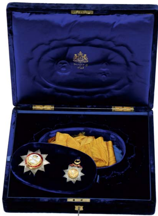
Obr. 4. Etuje Nejvznešenějšího řádu johorské královské rodiny s dochovanými součástmi řádu.