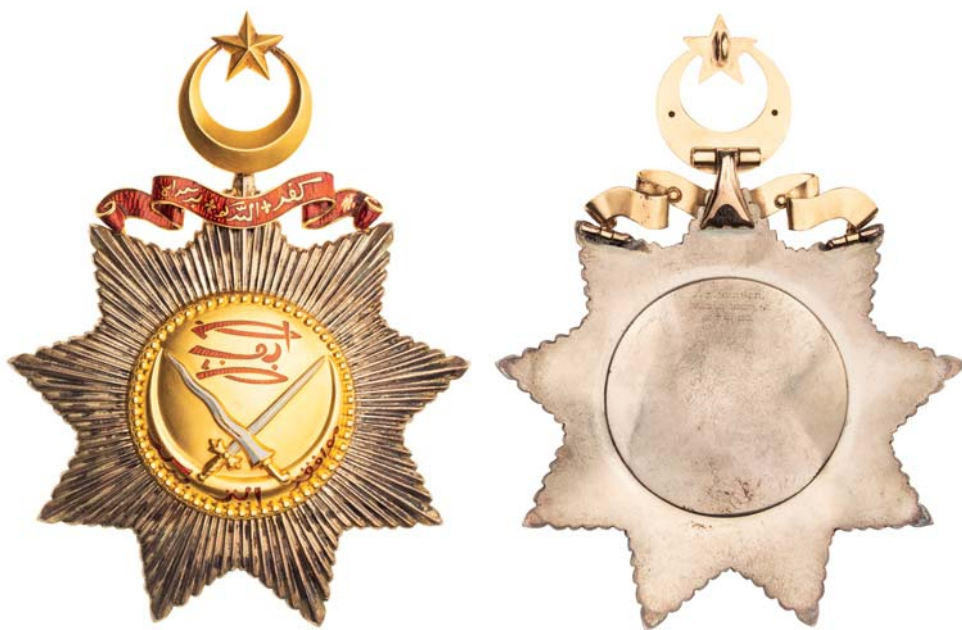
Obr. 6. Klenot I. třídy Nejvznešenějšího řádu johorské královské rodiny, avers a revers (foto Abalon s.r.o.).

novitých paprsků. Zlatý středový medailon nese uprostřed nahoře červenými stylizovanými znaky napsané jméno zakladatele řádu sultána Abu Bakara. Překřížený meč (zprava) a kris (zleva) pod znaky mají bílé smaltované čepele se zlatými žlábkami. Hroty se dotýkají rohů stoupajícího půlměsíce, který nese v červeném písmu jawi řádové heslo Muafakat itu berkat (Svornost je požehnání). Okraj medailonu zdobí perlovec. Hvězdu převyšuje zlatá pěticípá hvězda mezi rohy stoupajícího půlměsíce a červeně smaltovaná páska s nápisem vyvedeným zlatým písmem jawi Kepada Allah Berserah (Podrobte se Alláhuvi). Na rubní straně medailonu je nahoře vyryto značení firmy J. W. BENSON. / 25. OLD BOND ST. / LONDON. (obr. 6). 14 Žlutá řádová šerpa široká 88 mm má pod mašlí zavírací očko na přichycení klenotu.