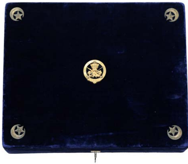
Obr. 3. Etuje Nejvznešenějšího řádu johorské královské rodiny, pohled shora.