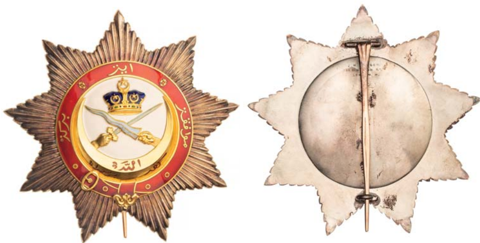
Obr. 5. Řádová hvězda I. třídy Nejvznešenějšího řádu johorské královské rodiny, avers a revers.

Řádová devíticípá hvězda , vyrobená ze stříbra o rozměru 88,5 mm, průměru středového medailonu 51,1 mm (bez opasku 39,5 mm), a váže 78,7 g, má složené cípy z jehlanovitých paprsků. Středový bíle smaltovaný medailon nese uprostřed nahoře korunu sultanátu Johor. Pod korunou ruce drží překřížený meč (zprava) a kris (zleva), oba s bíle smaltovanými čepelemi. Ostří, žlábký zbrání i ruce jsou zlaté. Hroty směřují k rohům stoupajícího zlatého půlměsíce s červeným nápisem v písmu jawi Kepada Allah Berserah (Podrobte se Alláhovi). Vše obepíná červeně smaltovaný pás se zlaceným kováním a dvěma květy dělicími znaky řádového hesla v písmu jawi Muafakat itu berkat (Svornost je požehnání). Připínací jehlice na rubu probíhá svisle. Uprostřed nahoře je vyryto značení firmy J. W. BENSON. / 25. OLD BOND ST. / LONDON. W. (obr. 5).