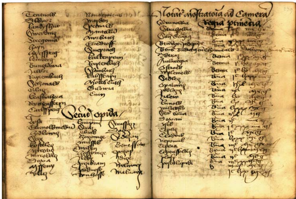
Obr. 2. Příjmy ze zvláštní berně královských klášterů v Čechách podle opisu ze starých zemských desek; stav k počátku roku 1471 (Knihovna Národního muzea, oddělení rukopisů a starých tisků, sign. I F 23, fol. 239).

Nezanedbatelný význam měl spolu se zvláštní berní odváděnou z královských měst a klášterů v celkovém objemu zeměpanských příjmů i výnos z hradů s jejich panstvími. Poněkud jiná situace však byla na Moravě, kde výtěžek ze zmenšujících se markraběcích statků v důsledku jejich častého zastavování církevním institucím, šlechtě stojící v blízkém vztahu k panovníkovi a městům obvykle kryl jen obživu posádky a hradního správce. 40 Jestliže se pro prostředí vlastních Čech zachovaly údaje pro výši odváděné zvláštní berně u 28 měst a 28 klášterů, pak jsme u výnosů statků českých zeměpanských hradů odkázáni pouze na torzovité informace. Zmíněný opis ze zemských desek totiž zmiňuje dávky placené pouze osmi královskými hrady v Čechách a hrady v Budyšině, Kladsku, Vratislavi a dolnoluzickém Luckau. Většina záznamů uvádí celkový výnos statků patřících ke konkrétnímu hradu, plat určený jeho purkrabímu a zůstatek představující skutečnou částku, která putovala do královské komory. Ta bývala často nižší než odměna hradnímu správci, což dokládají např. účty hradů Lokte, Vratislavi nebo Luckau. Které z opevněných sídel zmíněných v soupisu odvádělo nejvyšší a které naopak nejnižší dávky, nelze jednoznačně rozhodnout, protože u Zvíkova, Hluboké