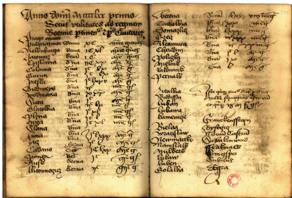
Obr. 1. Příjmy ze zvláštní berně královských a věnných měst v Čechách podle opisu ze starých zemských desek; stav k počátku roku 1471 (Knihovna Národního muzea, oddělení rukopisů a starých tisků, sign. I F 23, fol. 238).

Při vypočtené průměrné částce 157 kop pražských grošů, kterou by teoreticky odvádělo jedno město, by bylo možné odhadnout přibližný výnos ze zvláštní berně všech asi 35 královských a věnných měst na 5000–6000 kop pražských grošů. Uvedená suma se však týká pouze měst ve vlastních Čechách, neboť do ní nejsou zahrnuty dávky z měst na Moravě a ve vedlejších zemích Koruny české. Je však zapotřebí připomenout, že jde o celkový objem vybrané městské berně a že v královské komoře tradičně končila po odečtení zastavených platů panovníkovým věřitelům nižší finanční částka. Zohledněna byla skutečnost, že privilegovaná města jako Staré a Nové Město pražské a Kutná Hora byla od placení zvláštní berně osvobozena.