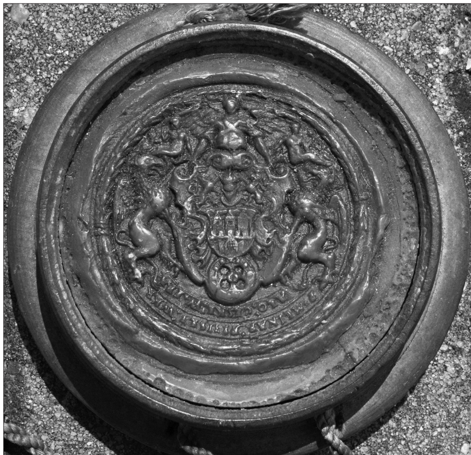
Obrázek 1 – Pečeť přísežných zemských mlynářů přivěšená k artikulím nymburského cechu mlynářů, 1660 (SOKA Nymburk, Cech mlynářů a krupařů Nymburk, inv. č. 1).

Ize setkat také se scénami ze života patronů řemesla, žánrovými pohledy do dílny a často také se jménem či iniciálami panovníka, který cechu udělil či polepšil znak. 3