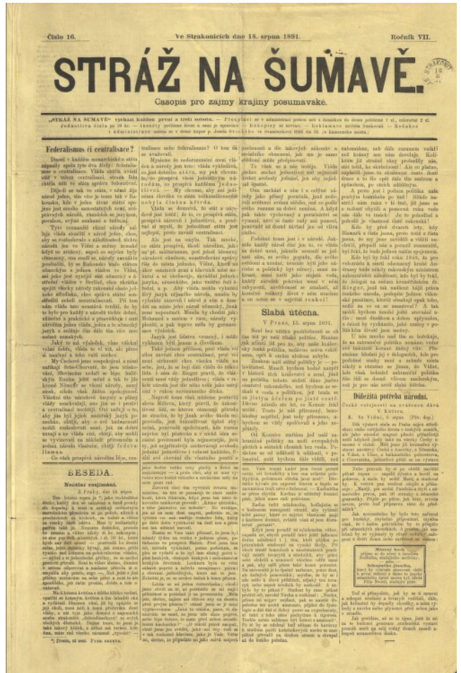
Obr. 2. Titulní list časopisu Stráž na Šumavě 7, 1891, č. 18.

V prvním čísle Stráže na Šumavě zde dne 4. 4. 1885 nalezneme ve zkratce základní cíle a program plánovaných periodik. K hlavním jejich úkolům patřilo hájení zájmů takzvaného „ Našeho Pošumaví “. Jestliže necháme promluvit redakci, tak se jednalo z hlediska vymezení „o český jihozápad se