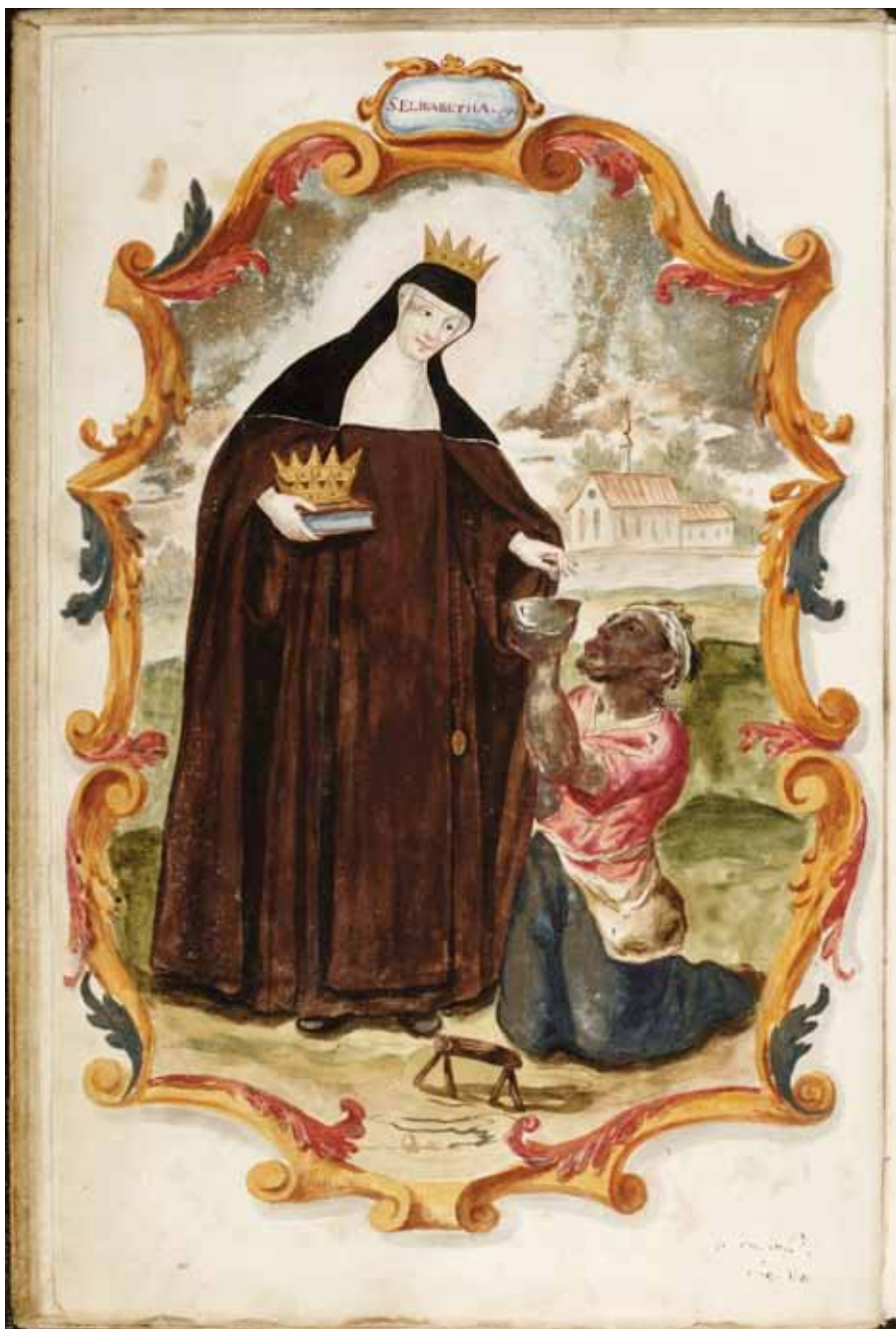
Hlasová kniha – sopránový hlas z graduálu, vyobrazení svatě Alžběty, fol. 1 v , 1736 / Part book – soprano part from a gradual, depiction of Saint Elizabeth, fol. 1 v , 1736

Národní knihovna České republiky, sign. 59 R 5004 / National Library of the Czech Republic, shelf mark 59 R 5004