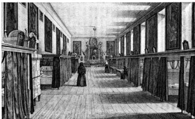
Hlavní nemocniční sál v nemocnici sv. Alžběty Na Slupi / Main hospital hall at Saint Elizabeth's Hospital at Na Slupi

Z partů je zřejmé, že se provedení Operetta nepřipravovalo jen jednou. Text „Kindliche Liebe“, v původní vrstvě přímo oslovující matku představenou M. Deodatu, je později