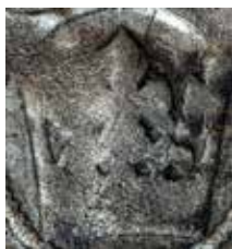
● 1: Detail koruny groše č. 1.

V blíže neupřesněné lesní poloze nedaleko zříceniny hradu Libštejn (okr. Rokycany) byly nalezeny na různých místech dva pražské groše s titulaturou Václava IV. Lucemburského. První byl získán ke zpracování v roce 2011 (č. 1), druhý s odstupem tří let v roce 2014 (č. 2).