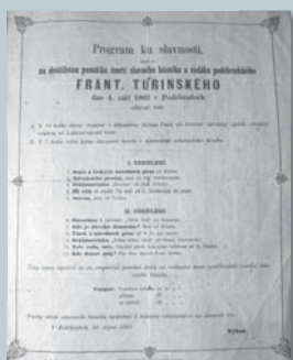
Program slavnosti v Poděbradech roku 1862 (LA PNP)