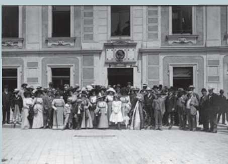
Oslavy v Poděbradech roku 1882 u příležitosti odhalení pamětní desky F. Turinského od Bohuslava Schnircha na jeho rodném domě