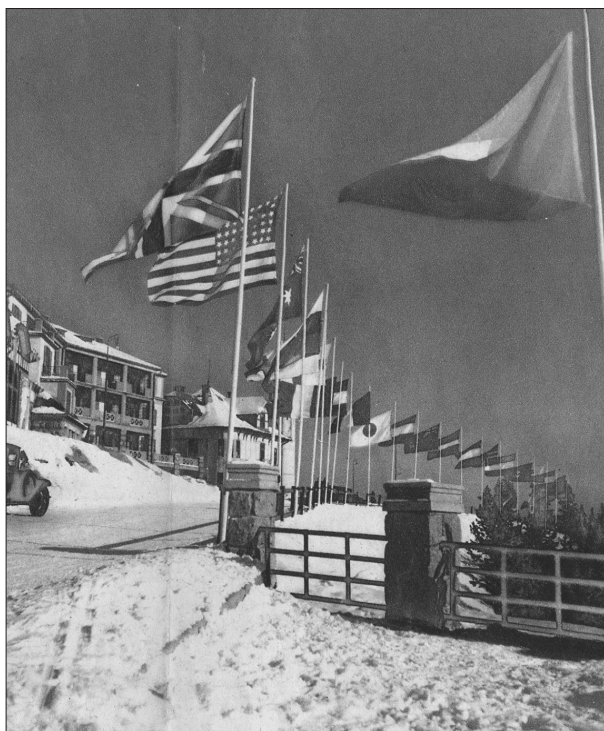
Obrázek 1 – Mistrovství světa v Tatrách 1935. ATVS, fond Růžena Beinhauerová, inv. č. 110, Album s novinovými výstřižky a fotografiemi, 1934

Navzájem však spolupráce lyžařských organizací vázla. I přes uzavřenou dohodu ohledně pořádání závodů, začal KČT v zimě 1931 pořádat své celorepublikové lyžařské