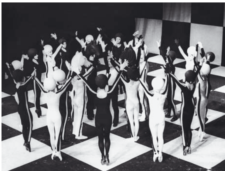
Ukázka z výstavního panelu k inscenaci baletu Bohuslava Martinů Šach králi / Part of the exhibition panel devoted to a staging of Martinů's ballet Šach králi (Check to the King)