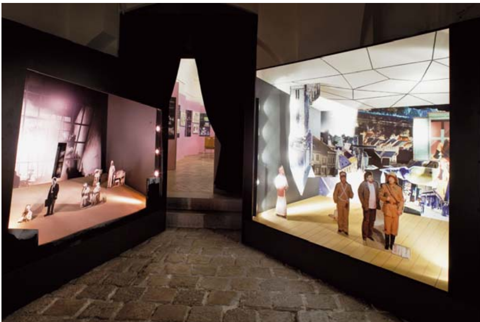
Fenomén Martinů, modely scény k opeře Julietta / The Martinů Phenomenon, set models for the opera Juliette

Martinů byl v mnoha směrech výjimečný umělec. Měl hluboký zájem o poznatky z oborů uměleckých, společenských i technických, zajímalo ho náboženství, fyzika atd. Dokázal přesně a inspirativně popisovat, jak si své dílo určené pro jeviště představuje. Svoji vyhraněnou představu divadla si tříbil výměnou názorů s mnoha osobnostmi českého umění, a to nejen formou korespondence, ale také častými osobními kontakty, např. s Václavem Talichem, Jindřichem Honzlem, Vítězslavem Nezvalem a Františkem Muzikou.