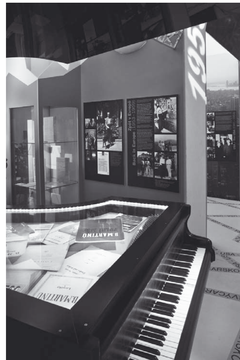
Panely a exponáty týkající se konce života Bohuslava Martinů / Panels and exhibit items pertaining to the end of Martinů's life