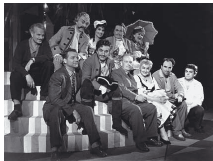
Ukázka z výstavního panelu k inscenaci opery Bohuslava Martinů Mirandolina / Part of the exhibition panel devoted to a staging of Martinů's opera Mirandolina