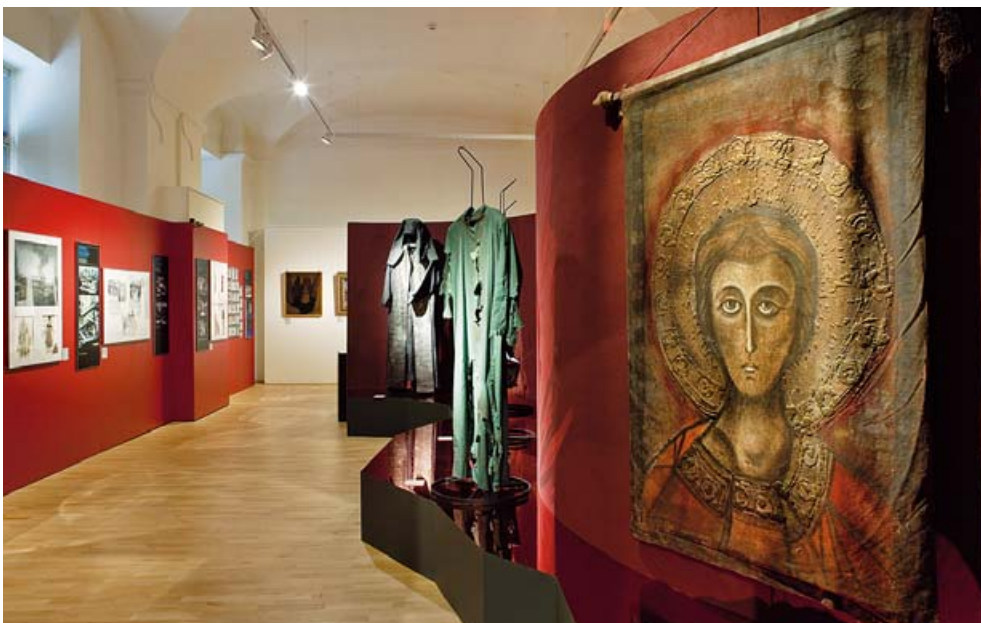
Fenomén Martinů, poslední výstavní sál, věnovaný Řeckým pašijím / The Martinů Phenomenon, the last exhibition hall, devoted to The Greek Passion