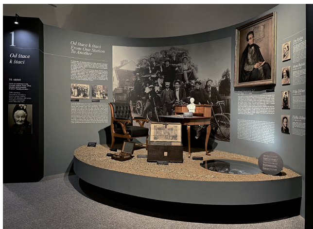
Obr. 3. Pohledy do výstavy.

V prvním sále, v tzv. pravém kuloáru bývalého federálního shromáždění, jsme tuto paletu témat návštěvníkům představili diachronně vyprávěním, které zprostředkovala zejména dioramata z nábytku a velkých 3D artefaktů, ve vitrínách pak doplňkově osobními předměty, jako jsou například oděvy, šperky, kuřácké potřeby, šminky a sady na líčení, tzv. trofeje, společenská ocenění a vyznamenání, vesměs z pozůstatostí jednotlivých aktérů. Vše jsme doplnili jejich medailony s fotografiemi a dalšími dokumenty, včetně audiovizuálních médií. Vybrané osobnosti pokaždé reprezentují svou generaci