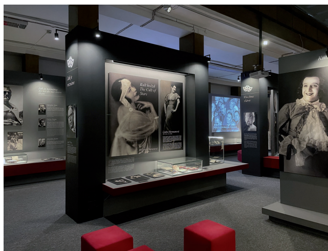
Obr. 1 a 2. Pohledy do výstavy.

umění odlišuje. Například spisovatel může psát „do zásuvky“, malíř vystavovat a prodávat své obrazy jen ve svém ateliéru, případně vydavatel či producent šířit literaturu, hudbu či film ineditně, eventuálně až ve svobodných časech. Herec buď veřejně hraje, nebo nehraje, a to vždy jen ve svém životním čase. Příklady z tzv. undergroundu – bytového divadla – jsou jen ojedinělé a velmi specifické.