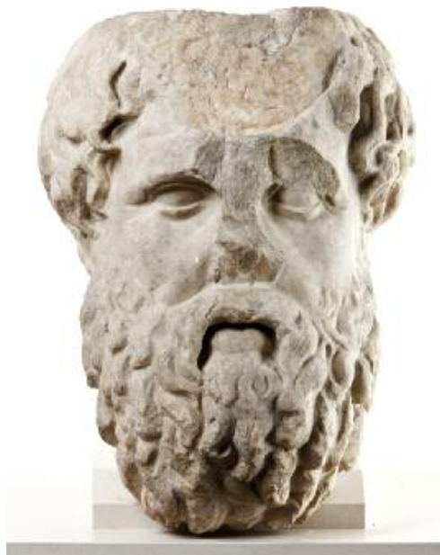
Mužská hlava pocházející ze 2. stol. n. l. je římskou replikou typu vousatého boha vytvořeného řeckým sochařem Bryaxidem ve 4. stol. př. n. l. Hlava v nadživotní velikosti byla původně nasazená na barokní pískovcovou bustu, která tvořila součást výzdoby zámecké zahrady ve Vlašimi.

Figurální umění doplní skupina terakotových plastik. Vývoj kyperského hrnčičství bude reprezentovat soubor keramických nádob. Ukázky minojského a mykénského umění, které se v evropských sbírkách nachází relativně vzácně, budou představeny skromnější kolekcí, doplněnou kopiemi náleží ze šachtových hrobů v Mykénách.