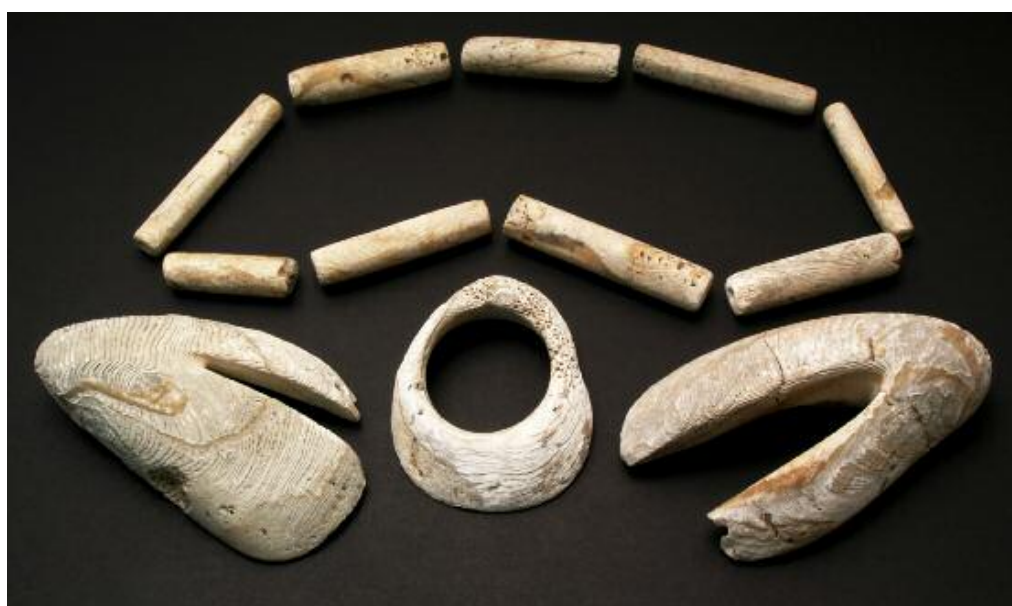
Ozdoby zhotovené ze schránek mořského mlže ostnovky středomořské (Spondylus gaederopus) z Kadaně. Spondylový šperk nalézáme téměř výhradně v hrobech nejstarších zemědělců ze starší fáze mladší doby kamenné (2. pol. 6. tis. př. n. l.).

Vedle působivých originálních památek bude atraktivita expozice podtržena prezentací pravěkých dějin jako aktuálního tématu, jež významně přispívá k pochopení současnosti. V prehistorickém období totiž můžeme hledat počátky většiny společenských jevů a procesů, které nás doprovázejí do dnešních dnů. Již tehdy také člověk začal zásadně ovlivňovat životní prostředí a vzhled krajiny. Prehistorická expozice se tak stane příspěvkem k pochopení nás samotných: příběhy kontinuit vyprávějících o tom, co současná civilizace převzala od civilizací minulých,