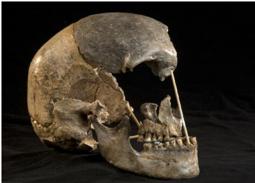
Lebka magdalénienské ženy nalezená v jeskyni Zlatý kůň v areálu Koněpruských jeskyň.

v několika úrovních podle podrobnosti sdělených informací. Zájemcům o hlubší poznání problematiky poslouží informace na dotykových panelech, které budou obsahovat i výukové programy či volitelné filmové sekvence a interaktivní prvky. V rámci dětské linky bude možné například sestavit lidskou kostru, porovnat stavbu kostí současného člověka se stavbou kostí našich předků a zvířat či rekonstruovat podobu našich předchůdců.