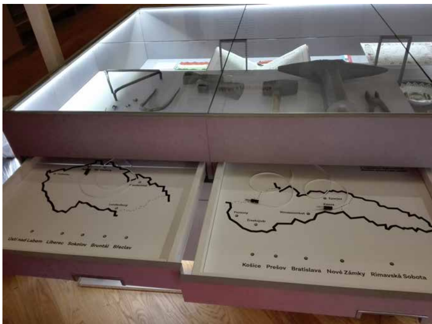
Elektronická spojovačka, jejímž prostřednictvím se návštěvníci seznamovali s německými názvy českých a maďarskými názvy slovenských měst, 2018

Zásuvky s interaktivitami byly označeny zelenou barvou. Odlišovaly se tak od ostatních zásuvek, které ve výstavě ukrývaly další sbírkové předměty nebo doplňková témata.