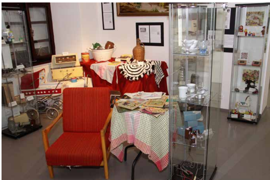
Část výstavy žáků kvarty Gymnázia Karla Čapka v Dobříši, Muzeum Dobříš, 11. 1. 2018

zkušenosti; nové znalosti/poznatky/informace; zážitek; pobavení; bližší vztahy se spolužáky; informace o rodinách mých spolužáků; zjištění, že když se jako třída rozhodneme, tak jsme schopni udělat nádhernou výstavu; další krásné chvíle strávené s babičkou/dědou; vzpomínky; zlepšení ve psaní slohové práce.