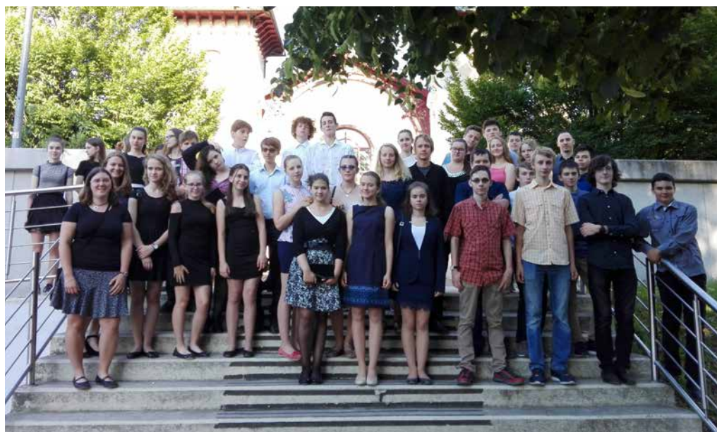
Společná fotografie žáků Gymnázia Karla Čapka v Dobříši a Gymnázia Malacký před představením Dubček v Divadle Arena, Bratislava, 19. 6. 2018