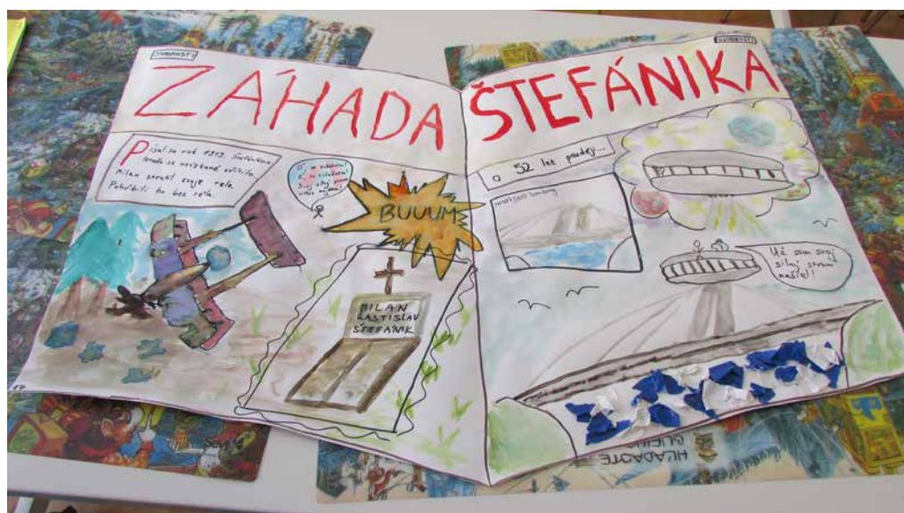
Jeden z vytvořených komiksů, Bratislavský hrad, 19. 6. 2018

Workshop pro vítězné kolektivy na téma tvorby vlastního komiksu, Bratislavský hrad, 19. 6. 2018