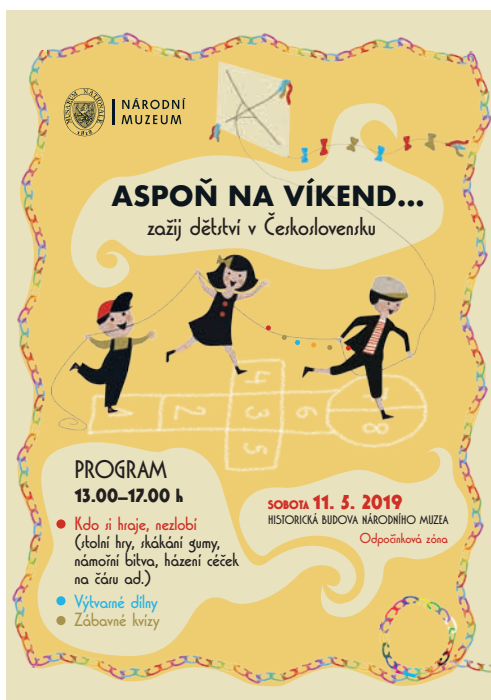
Plakát akce Aspoň na víkend... zažij dětství v Československu, Národní muzeum, 11. 5. 2019

Achilleovou patou besed s pamětníky je jejich věk, fyzická a duševní kondice. Jak se i nám stalo, dvaadvadesátiletého pamětníka zradila paměť i schopnost koncentrace a svůj příběh, který mi ještě cestou do muzea zaujatě vypravoval v taxíku, již nedokázal sdělit žákům. I přes to, že by se dalo říci, že tato beseda neměla pro žáky význam, to, že si šli s pamětníkem následně pohovořit a podat mu ruku, svědčí o tom, že je jeho vyprávění oslivilo. Nutno ještě upozornit na politováníhodnou skutečnost, která se s touto zkušeností pojí, že ještě před skončením besedy opustili někteří žáci i jejich pedagogický