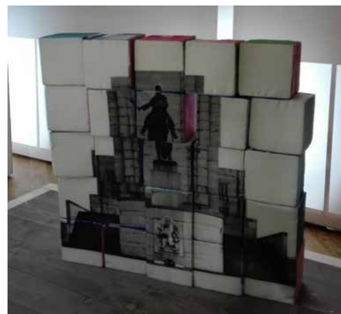
Stavebnice z molitanových kostek, na jejichž jednotlivých stranách bylo vyobrazeno šest významných českých a slovenských staveb. Pro děti zábava, pro starší návštěvníky relaxace