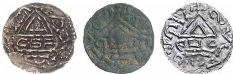
●□3: Srovnání reversu imitativní ražby M-03 z Radslavic (uprostřed) s jednou z variant denáru Cach 13 i 14, resp. Hahn 2002, . 28, 57 (vlevo) a Cach 13, resp. Hahn 2002, . 30 (vpravo). Zv. tšeno 1,5:1.

V průběhu příprav této studie, která je publikacím zpracováním příspěvku předneseného na konferenci v Bechyni na podzim rok 2015, došlo k odkrytí dalších pravděpodobně zcela nových depotů, jejich obsah má pro danou problematiku značný význam. Bohužel, jak je obvyklé snad ve všech dobách, shromáždění v rozhodných a úplných poznatcích o jejich obsahu naráží na různé obtíže. Prvním z nich je údajný poklad mincí, šperků a zlomkového stříbra objevený zřejmě na dnešním česko-polském pomezí, podle neověřených informací v prostoru mezi Broumovem a Walbrzychem. Jeho součástí mohl být i český denár 9bodového typu v počtu několika desítek, které se následně objevily v numismatických aukcích i v nabídce několika obchodníků. V depotu, jehož datum uložení podle dostupných informací spadá někde kolem roku 980, byly kromě regulérních ražeb zastoupeny i různé imitace, včetně dosud neznámých