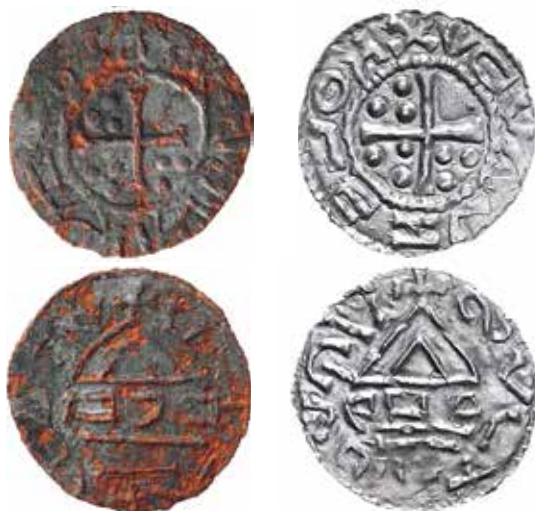
●□2: Srovnání imitativní ražby B-07 z Libice (vlevo) s denárem Cach 13 (vpravo). Zv. tšeno 1,5:1.