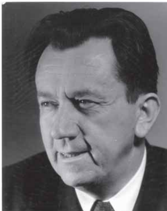
Bohumír Štědroň (1905–1982)

Při hledání názvu studie se nabízelo parafrázovat některý starší text. V případě B. Štědroňe jsem postrádal časové vymezení a rozdělení na husovské a husitské, naopak jsem zachoval zdůraznění českosti a internacionálnosti tématu. Převzal jsem i širěji vymezený termín „hudba“, třebaže jsem se soustředil jen na skladby. Zčásti jsem se inspiroval u studie Jany Fojtíkové Hudební doklady Husova kultu z 15. a 16. století. Příspěvek ke studiu husitské tradice v době předbělohorské (in: Miscellanea musicologica , XXIX, Praha 1981, s. 51–145). Za vhodnější než slovo kult však považuji spojení „druhý život“. U slova „kult“ totiž nelze vyloučit existenci kultu ještě za života sledované osoby. Naopak jsem se ztožnil s používanou dvojicí „husovský – husitský“.