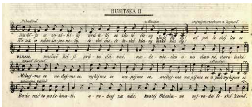
Josef Theodor Krov: Husitská II (Naděje se vyplnily) / Josef Theodor Krov: Hussite II (Hopes Were Fulfilled) Část písně otiskněná ve Zpěvníku Slávie / Part of a song printed in the songbook Zpěvník Slávie, 1848 NM-ČMH XXX C 39