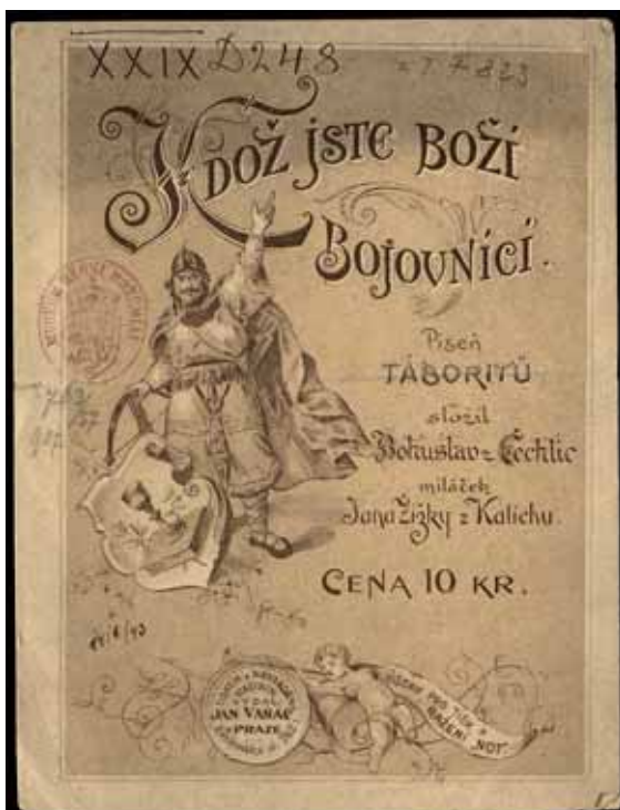
Kdož jste boží bojovníci. Píseň táboritů / Ye Who Are Warriors of God. Song of the Taborites Titulní strana, tisk, Jan Vaňáč, Praha, 2. pol. 19. stol. / Title page, printed edition, Jan Vaňáč, Prague, 2 nd half of the 19 th century NM-ČMH XXIX D 248