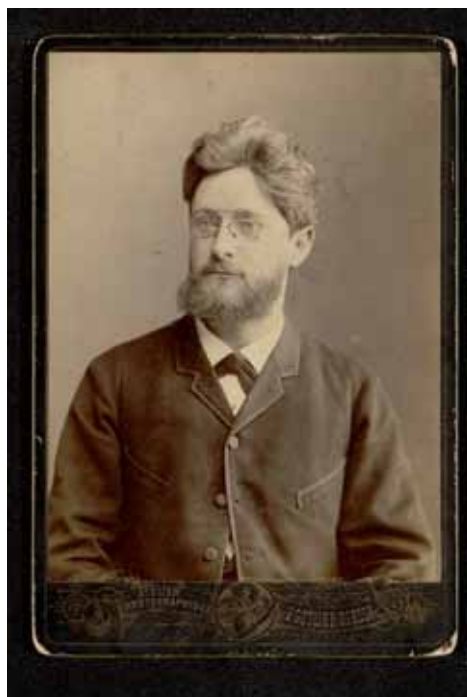
Hynek Vojáček-Vsacký (1825–1916) Fotografie, ateliér B. O. Gottlieb, Oděsa, po roce 1853 / Photograph, studio of B. O. Gottlieb, Odessa, after 1853 NM-ČMH F 363