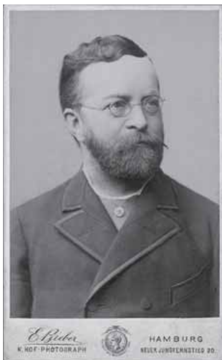
Jan Ludevít Procházka (1837–1888)

Fotografie, 80. léta 19. století / Photograph, 1880s