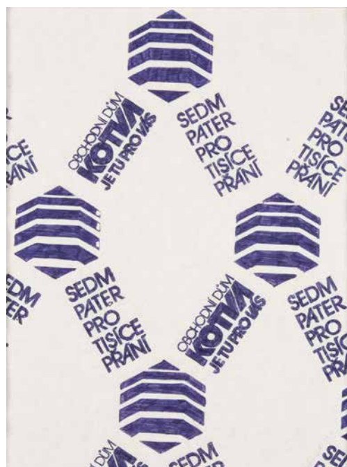
6. Jiří Georg Dokoupil, z cyklu Praha, 1990, kuličkové pero, papír, inv. č. SKT 497