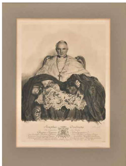
Max Švabinský, Biskup Josef Doubrava, 1913, lept, papír, inv. č. SKT 744