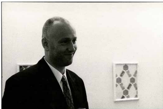
5. Jiří Georg Dokoupil Na bidýlku, Brno, červenec 1990

Součástí akvizice bohužel nebyly žádné dokumenty vztahující se k jednotlivým předmětům, nic, co by mohlo usnadnit zpětnou orientaci v tak rozsáhlém souboru uměleckých děl, jakým tato sbírka je. Díla jsou sice opatřena „inventárními čísly“, které kopírují soubory jednotlivých autorů, ale netvoří chronologickou řadu, která by jakýmkoli způsobem osvětlila postupný vývoj sbírky. 8