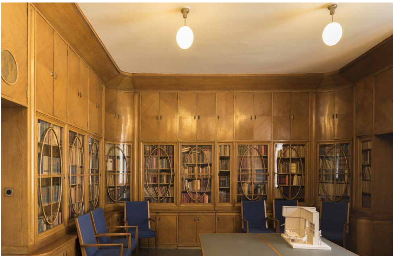
Obr. 2. Historická zasedací místnost rakouské sociální demokracie patří k reprezentativním prostorům sídla spolku, zdroj: ©VGA, Wien.