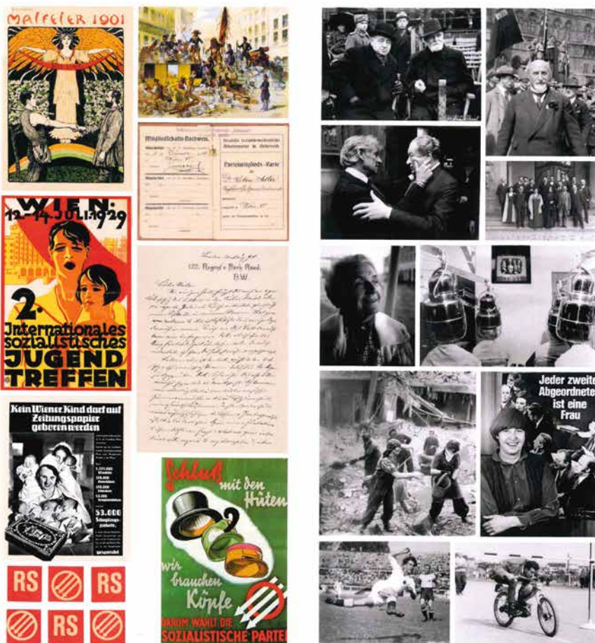
Obr. 7. Současný leták prezentace Spolku pro historii dělnického hnutí (2023), zdroj: Archiv Tomáše Kavky.

Forschung · Recherche · Publikationen · Archivalische Aufarbeitung · Vorträge · Ausstellungen · Symposien · Interviews · Wissenschaftliche Beratung