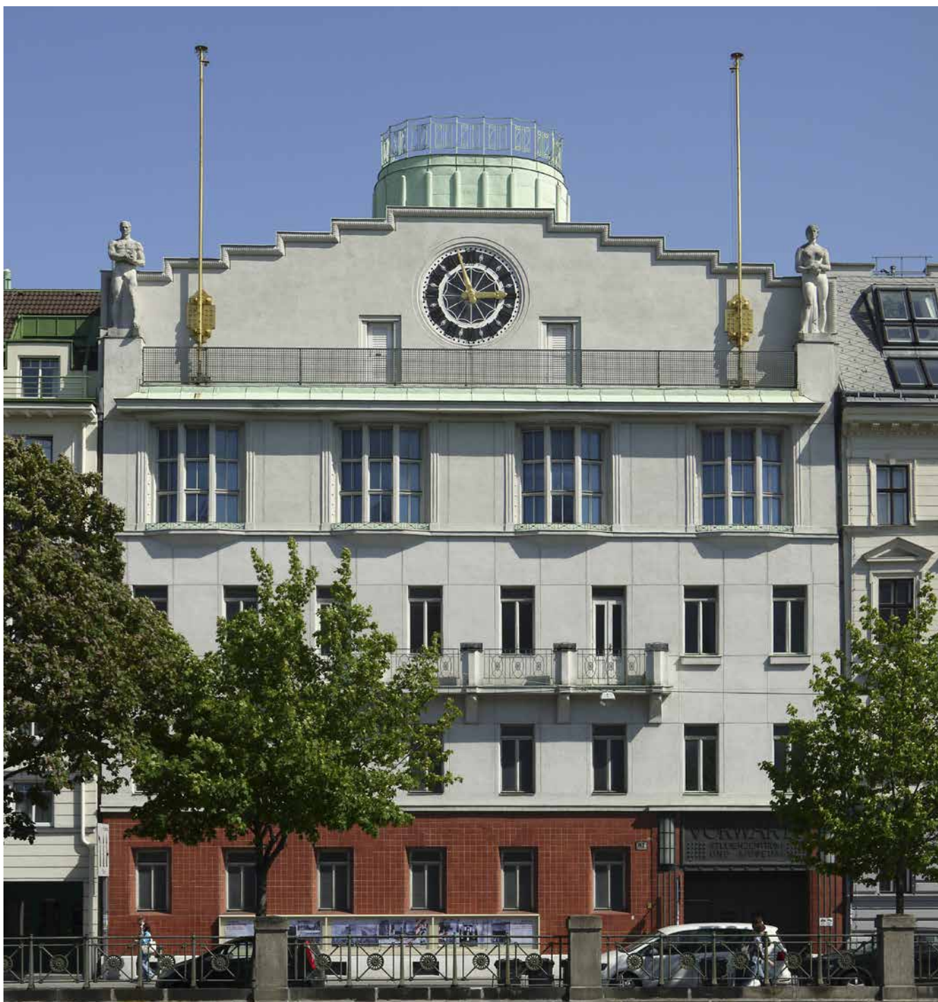
Obr. 1. Exteriér secesní budovy Vorwärts ve Vídni, zdroj: ©VGA, Wien.