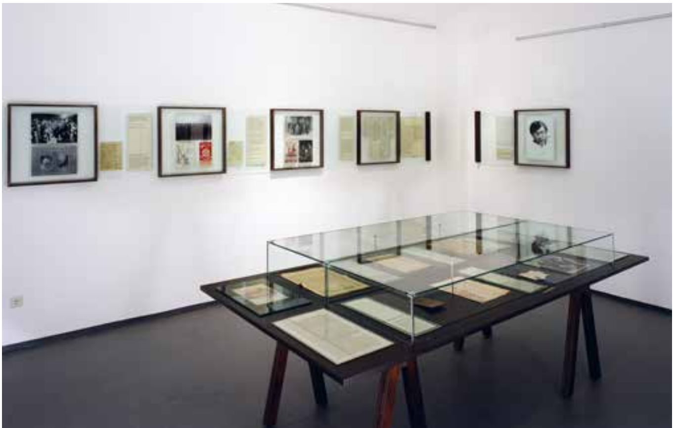
Obr. 5. Pamětní místnost Victora Adlera připomíná pamětní síně, které fungovaly v Československu do roku 1989, dnes by potřebovala rekonstrukci.