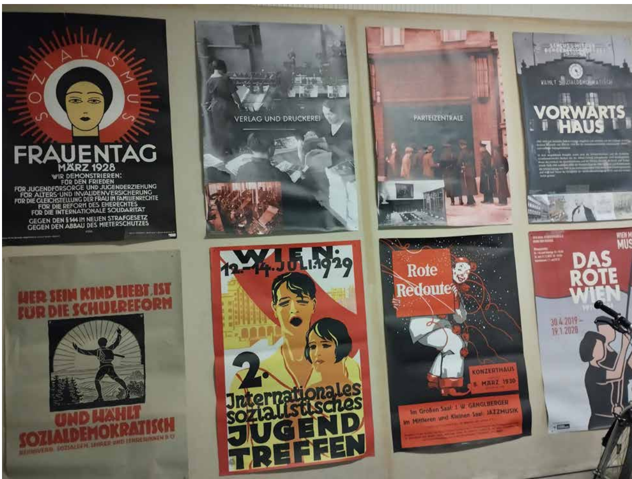
Obr. 3. V průčelí vstupu do budovy Vorwärts najdeme i zeď prezentující plakátové práce tiskárny Vorwärts, pro kterou byla na počátku 20. století budova postavena, foto: Tomáš Kavka.