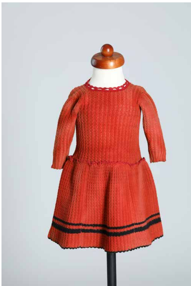
Obr. 6. Šatičky na 2–4leté dítě, z majetku L. Bráfové, 60. léta 19. století, rozměry: d. 44 cm. Foto: O. Tlapáková (Národní muzeum, H2-193413).

starší šaty odesílá, ale „ hoši vše nosí až do roztrhání “. 105 Nebo v jiném psaní Albína Bráfa je stručná poznámka, že do domu v Palackého ulici v Praze přišla žebračka a Albín jí dal jednu ze starých Libušiných košil. 106