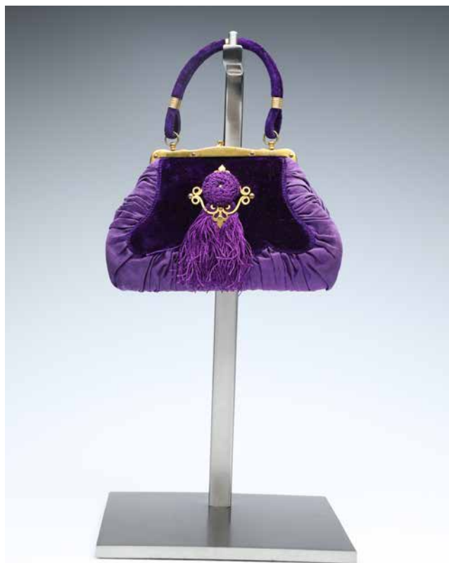
Obr. 13. Dámská kabelka, z majetku L. Bráfové, přelom 19. a 20. století, rozměry: 14 x 10,5 cm. Foto: O. Tlapáková (Národní muzeum, H2-187466).

Rámečková kabelka z přelomu 19. a 20. století je zhotovena z fialového sametu a řaseného saténu. Ve středu kabelky je v mosazném rámečku ukotven střípek z fialové bavlnky, stejná dekorace je aplikována i na druhé straně. Ucho kabelky je vyrobené z fialového sametu na třech místech zpevněného mosaznými kroužky. Vnitřek kabelky je vyložen fialovým saténem.