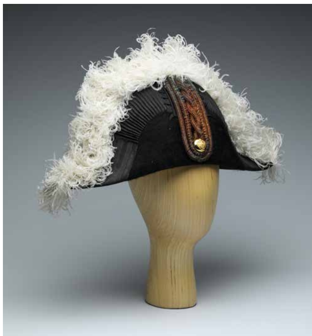
Obr. 17. Klobouk k úřednické uniformě, z majetku A. Bráfa, začátek 20. století, rozměry: 20 × 39 cm. Foto: O. Tlapáková (Národní muzeum, H2-143925).

podél vrcholu lemován černou rypsovou stuhou a po celém hřbetu bílým pštosím peřím. Na čelní straně je aplikována dracounová borta a knoflík ze žlutého kovu s plastickým reliéfem císařské orlice. Vnitřní okraj je zpevněn pruhem usně. Vnitřek dýnka je podšit bílým saténem s iniciálami „AB“. Pokrývka hlavy se dochovala v původní papírové krabici profilované pro tvar dvourohého klobouku.