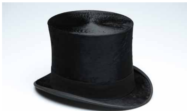
Obr. 16. Cylinder, z majetku A. Bráfa, do 1912, rozměry: v. 17 cm.

Ze začátku vyučoval na Obchodní akademii v Resslově ulici a také dával přednášky o národním hospodářství na škole Ženského výrobního spolku českého v Praze, první dívčí škole v celém Rakousku, kde se tento předmět vyučoval. 122 Od roku 1878 A. Bráf přednášel na české technice a od roku 1882 na své „alma mater“ – Právnické fakultě. 123 Důkazem, že Bráf byl vynikajícím rétorem a dokázal zaujmout nejen univerzitní publikum, svědčí jeho rozsáhlá popularizační