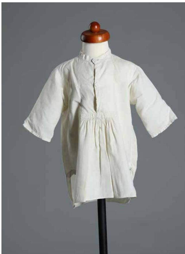
Obr. 19. Dětská košilka, 2. polovina 19. století, rozměry: d. 49 cm. Foto: O. Tlapáková (Národní muzeum, H2-193409).

nošena Václavem Bráfem. Košilka je v dobrém stavu, byla nejspíše uchována na památku. Za normálních okolností se osobní či spodní prádlo nedochovalo, nosilo se do roztrhání, poté se kusy látky zužitkovaly například na pleny, záplaty či hadry.