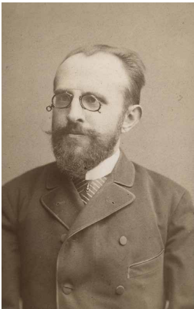
Obr. 15. Albín Bráf, konec 19. století.