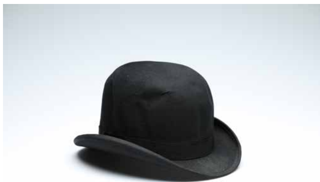
Obr. 22. Buřinka, z majetku V. Bráfa, 1900–1908, rozměry: v. 18 cm. (Národní muzeum, H2-143924).