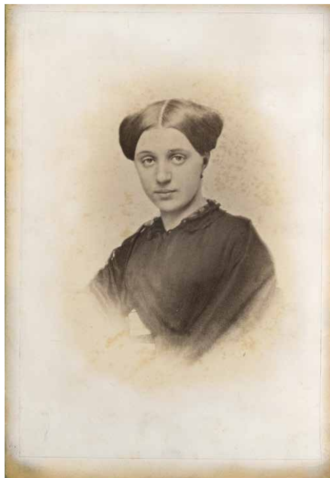
Obr. 2. Marie Palacká, kolem 1850 (Národní muzeum, H2-192824).

Poslední seznam, který je uložen v archivu oddělení starších českých dějin, je sepsán Věrou Přenosilovou, tehdejší kurátorkou textilu. V letech 1997–1998 společně s Lubomírem Sršněm zajišťovala rekonstrukci Památníku F. Palackého a F. L. Riegra. Seznam eviduje obsah krabic uložených v komoře u Riegrovy pracovny a ve skříních rozmístěných po celém interiéru. V seznamu není zaznamenán pouze tex-