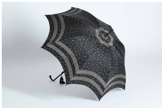
Obr. 14. Dámský deštník, z majetku L. Bráfové, 1. třetina 20. století, rozměry: d. 90 cm. Foto: O. Tlapáková (Národní muzeum, H2-143960).