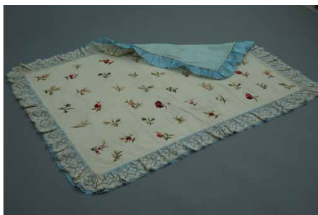
Obr. 21. Dětská pokrývka, poslední čtvrtina 19. století, rozměry: 142 × 109 cm. Foto: A. Kumstátová (Národní muzeum, H2-193420).

(technikou malby jehlou) barevnou bavlnkou květinovým vzorem – izolované květiny, např. konvalinka, růže rozkvetlá i poupě, chrpa, vřes, bledule, maceška, hvozdík. Příkrývka byla pravděpodobně vytvořena pro malého Václava. Návod na obdobný výrobek (poduška s rostlinnou výšivkou a krajkovou obrubou) byl zveřejněn v Nových pařížských modách . 142