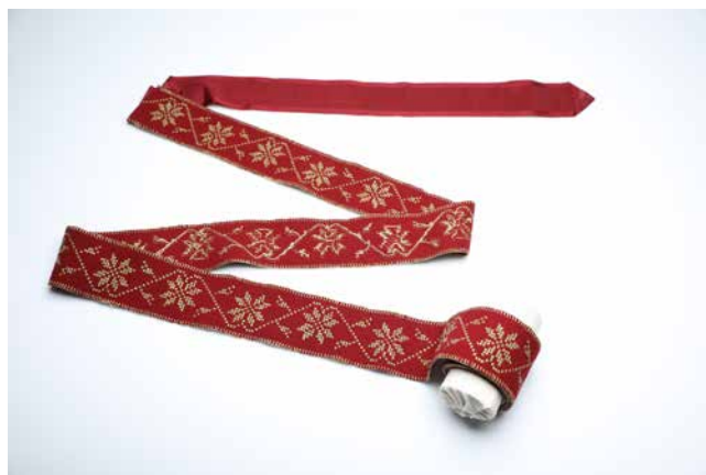
Obr. 20. Povijan, poslední čtvrtina 19. století, rozměry: d. 336 cm. Foto: O. Tlapáková (Národní muzeum, H2-193412).

Dětská pokrývka je obdélného tvaru rozměru 142 × 109 cm. Deka je vyrobena ze světlého vlněného sukna podloženého modrým plátnem. Po obvodu je aplikovaný volán překrytý paličkovanou krajkou. Pokrývka je vyšita plochým stehem