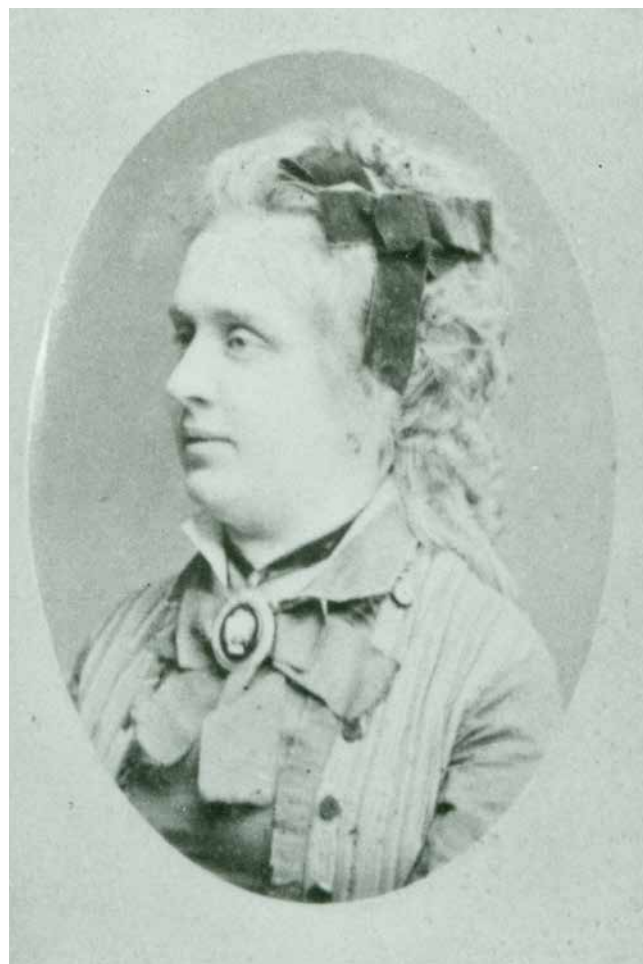
Obr. 3. Marie Červinková-Riegrová, 70. léta 19. století, Praha.