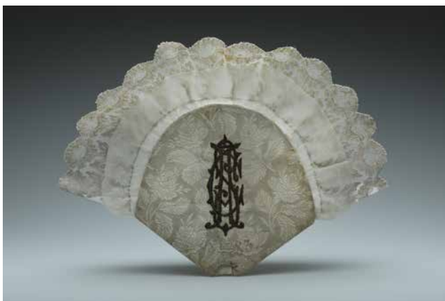
Obr. 11. Manžeta na plesovou kytici na ples Akademického čtenářského spolku, 1883, rozměry: 42 x 31 cm. Foto: A. Kumstátová (Národní muzeum, H2-198409).