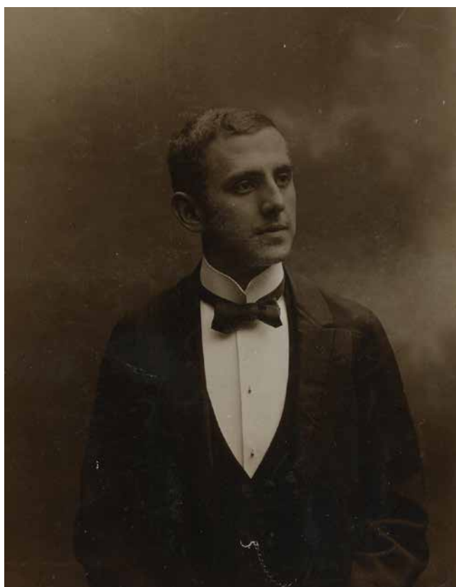
Obr. 23. Václav Bráf, kolem 1905 (Národní muzeum, H2-192888).