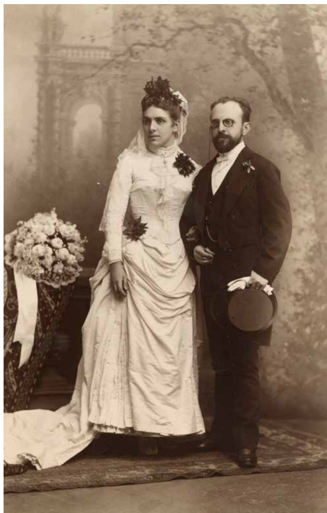
Obr. 10. Svatební foto novomanželů Bráfových, 13. 2. 1888, Praha (Národní muzeum, H2-192983).