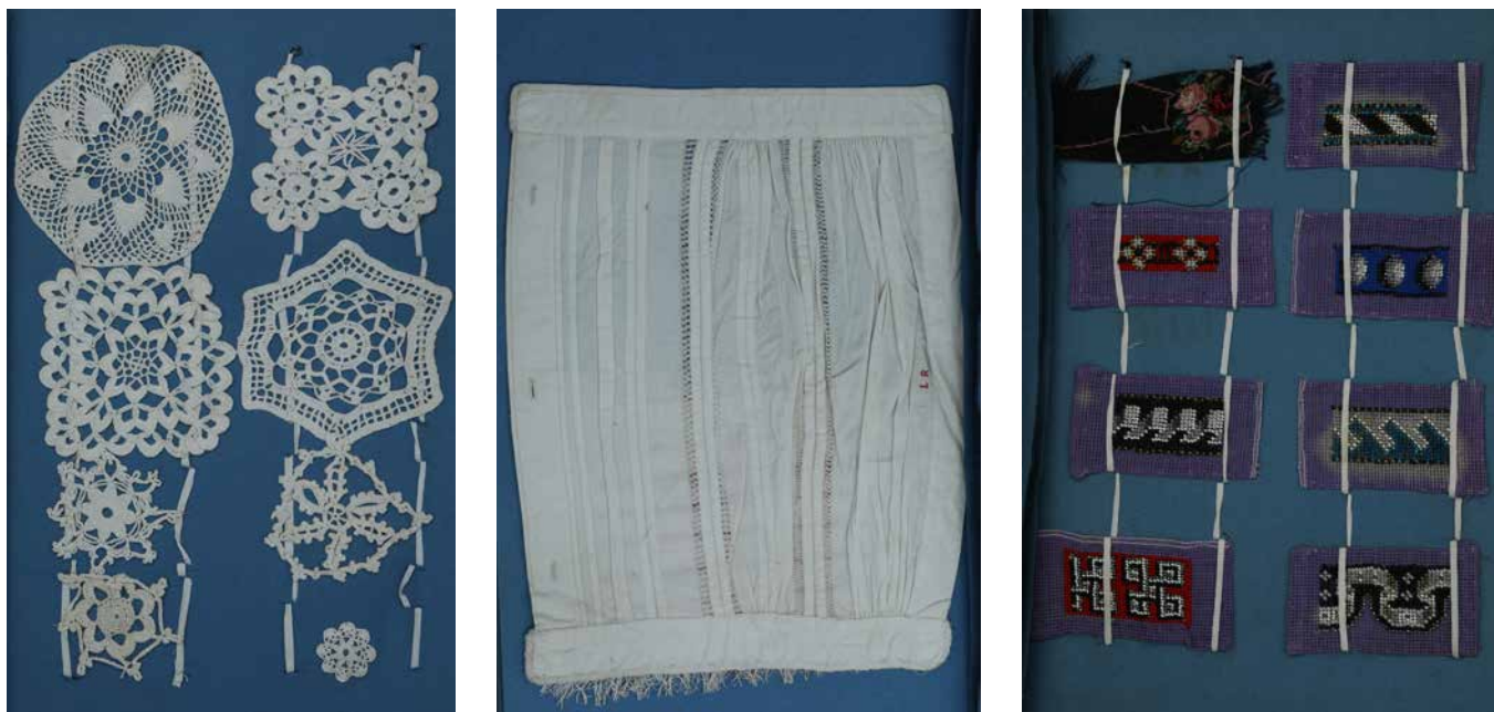
Obr. 8. Vzorník výšivek, krajek a šití Libuše Riegrové, 70.–80. léta 19. století. Foto: A. Kumstátová (Národní muzeum, H2-187487).

„LR3“, které nám naznačují, že majitelkou punčoch byla Libuše Riegrová (číslo tři není věk, ale označení páru). Délka chodidla je 18 cm, celková délka je 42 cm. Obě punčochy byly během užívání opakovaně spravované.