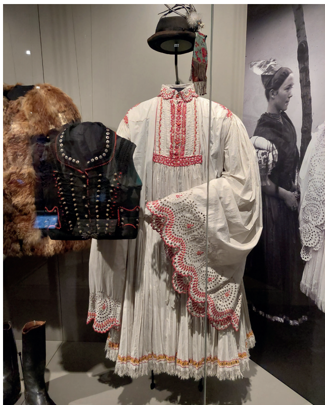
Obr. 1–4. Szentendrei Szabadtéri Néprajzi Múzeum, foto Anna Jagošová

Ve dnech 18. až 22. května 2025 se Etnografické oddělení Historického muzea Národního muzea vypravilo do Budapešti s cílem načerpat nové inspirace k vystavování a tvorbě etnografických expozic, a to právě v zemi, která nejenže má charakterově podobné národopisné bohatství jako Česká republika, ale především vykazuje neustále živou tradiční lidovou kulturu a díky tomu i poměrně velký zájem o tyto fenomény prezentované v paměťových institucích.