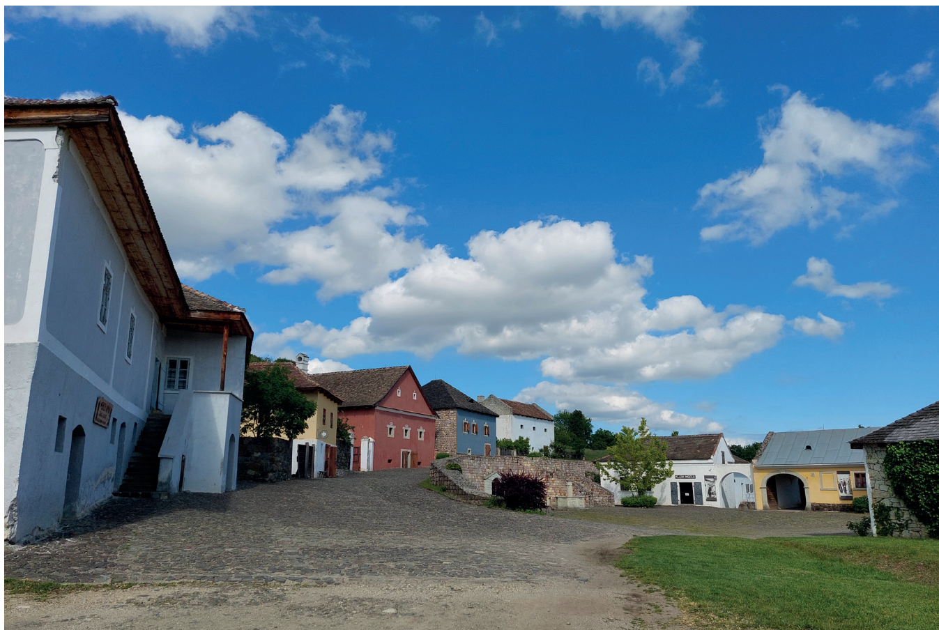
Obr. 5–10. Muzea etnografie: Néprajzi Múzeum

a kontrastně vzhledem k ostatním budovám, které buď obsahovaly tradiční vybavení interiéru, tak jak je známe z našich muzeí v přírodě, nebo byly návštěvníkům uzavřeny. Velice kladně jsme hodnotili ne mnohé, ale o to nápaditější „dětské koutky“, které prostřednictvím poměrně jednoduchých nápadů (krmení dřevěného koně plastovými míčky, sázení dřevěných mrkví nebo cibulí) přibližovaly interaktivním a hravým způsobem život našich předků malým návštěvníkům.