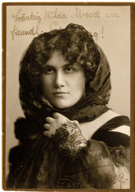
Emma Destinnová v roli [Donny Anny z Mozartovy opery Don Giovanni , 1904] /

Emmy Destinn in a role [as Donna Anna from Mozart's opera Don Giovanni , 1904]