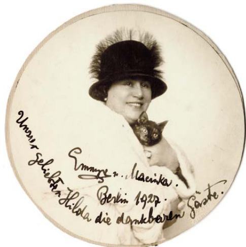
Emma Destinnová v bílé kožešinové pláštěnce, s černým kloboučkem, s kočkou v náručí / Emmy Destinn in a white fur coat and black hat, holding a cat

[1925] – Emmy Destinn in a white fur coat with a black hat, holding a cat 33 Dedication: "Emmy u. Macinka. Berlin 1927. Unserer geliebten Hilda die dankbaren Gäste."