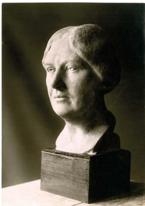
Fotografie busty Emy Destinnové / Photograph of a bust of Emmy Destinn

Hilda se v jednom ze svých dopisů zmiňuje o Josefu Halsbachovi, za kterého se Ema provdala. Ema na tento Hildin dopis reaguje 21. 11. 1923. Dlouho se plánovalo společné setkání obou manželů.