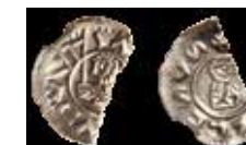
2.4. ECHY, Vratislav II., Cach 346.

Nalezi tĚ : Dziekanowice, hrob 26/99 [PL].