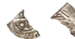
2.4. ECHY, Jaromir I., Cach 242, 248?

Nalezi tĚ : Dziekanowice, hrob 28/10 [PL].