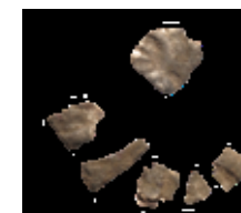
2.2. ECHY, Boleslav I., Cach 324?

Nalezi tĚ : Dziekanowice, hrob 27/96 [PL].