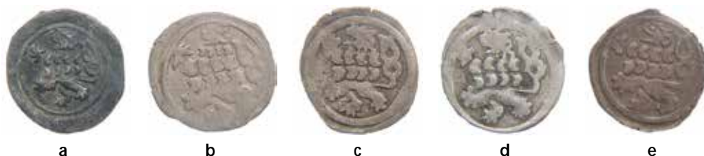
● □ 1: Porovnání provedení lva na tlustém penízu (a) se základními typy kruhových peněz se lvem. Typ Hána III/1 (b), typ Hána IV/1 (c), Typ Hána V/3 (d), Hána V/1 (e).

Karel Castelin 2 popisuje dvoustranné peníze se lvem a korunou pod čísly Cast. 55–57. V jeho případě se však nejedná o kruhové peníze, ale o peníze se ty rázem.