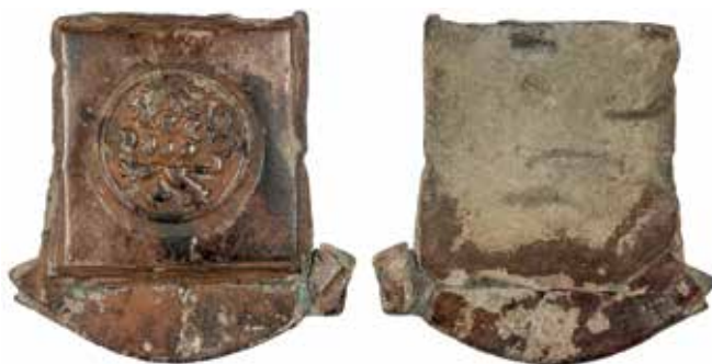
●□7: Etalon z nálezu Jeví ko 2014.

Posledním etalonem, se kterým je možné zmín ěný peníz porovnat, je etalon z nálezu Jeví ko 2014, který je uložen ve sbírkách Regionálního muzea v Lito-myšli. 10