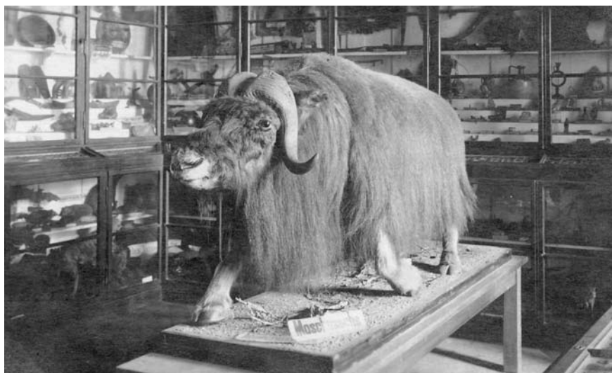
Obr. 4: Preparát pižmoně v jedné z místností Gymnazijního muzea před rokem 1945.