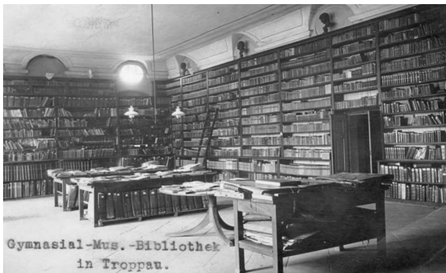
Obr. 1: Podoba knihovny Gymnazijního muzea ve třicátých letech 20. století na dobové pohlednici.