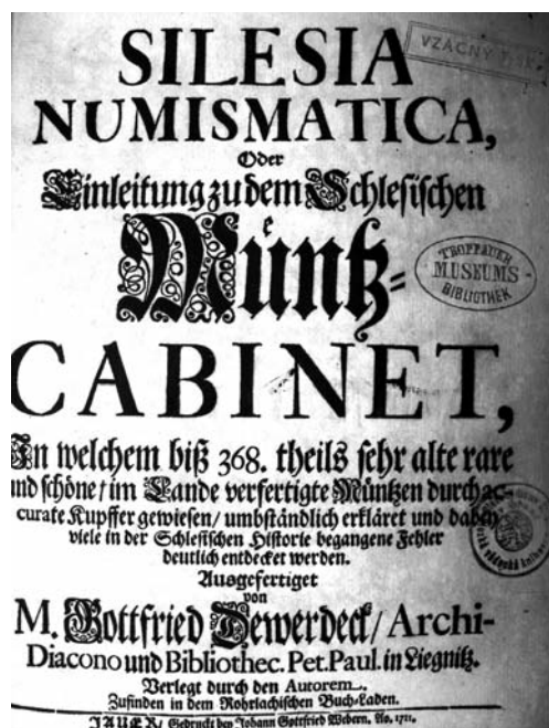
Obr. 3: Gottfried Dewerdeck, Silesia Numismatica , jeden z dochovaných tisků ze zničené knihovny Gymnazijního muzea, uložena v knihovně Slezského zemského muzea v Opavě.