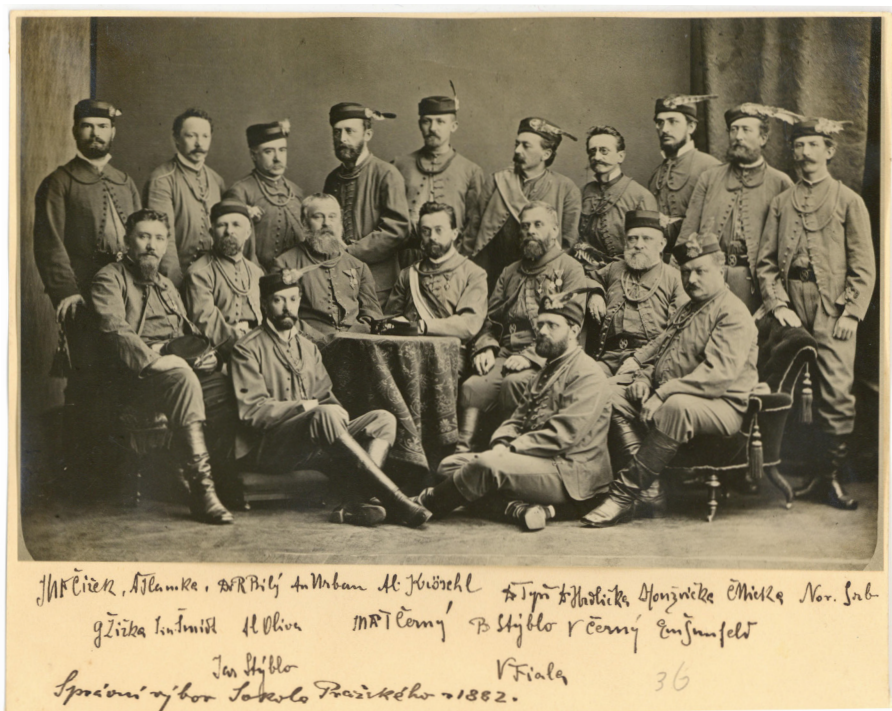
Obrázek 8 – Výbor Sokola pražského v roce 1882.

Vedl Akademický čtenářský spolek, byl zakládajícím členem Národní jednoty severočeské, člen výboru Slovanské lípy, zasedal ve slavnostním výboru pro kladení základního kamene Národního divadla, podílel se na založení Klubu českých turistů. Po absolvování právnické fakulty a získání doktorátu si v roce 1884 zřídil vlastní advokátní kancelář a ve stejném roce se po zemřelém Miroslavu Tyršovi jako jeho náměstek ujal vedení cvičitelského sboru Sokola pražského. 66 Zároveň byl jako jeden z jeho nejbližších spolupracovníků také zvolen do čela komise, která připravovala Tyršovu posmrtnou výstavu.