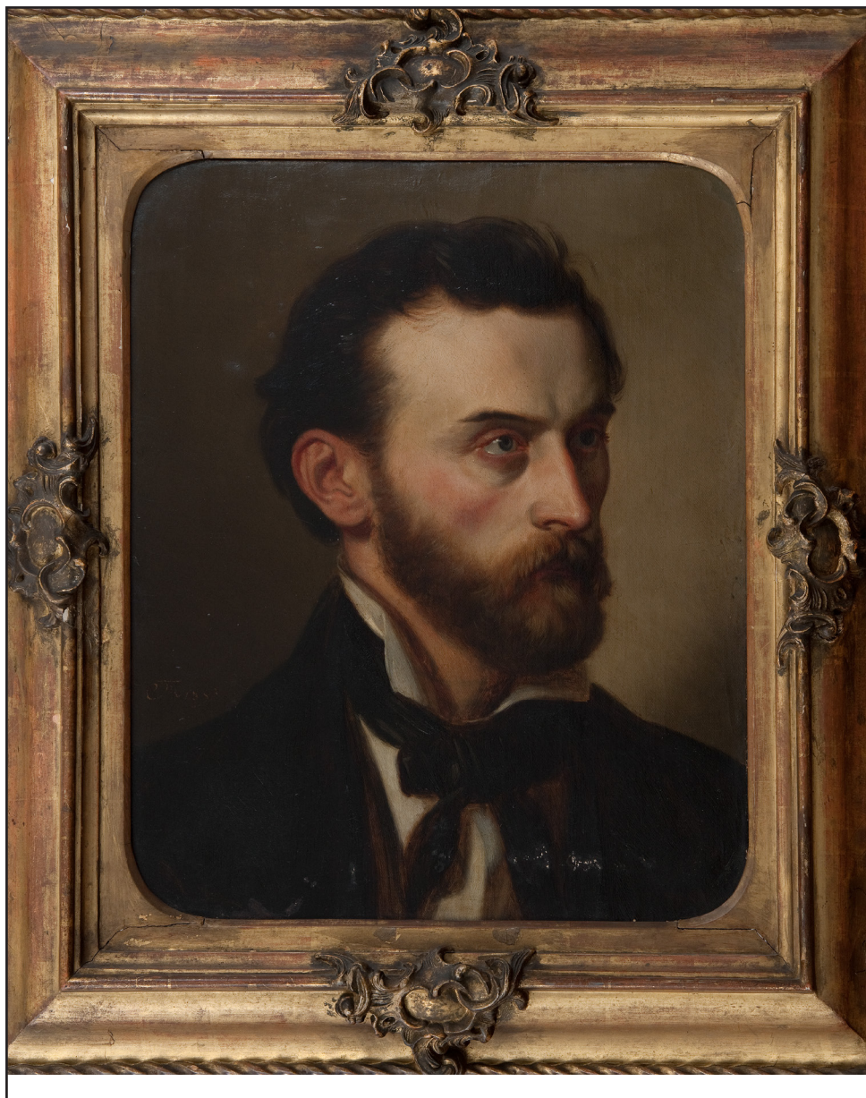
Obrázek 1 – Jindřich Fügner. Olej na plátně Josefa Mánesa (Národní muzeum, ODTVS, H7H-16172).