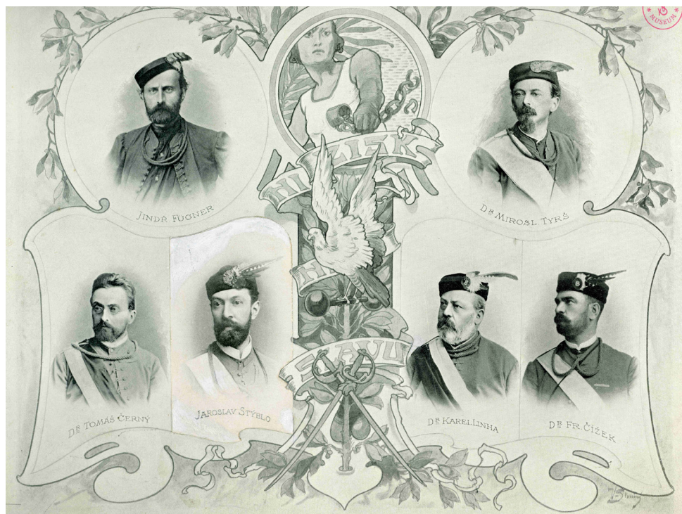
Obrázek 3 – Tablo činitelů Sokola pražského, tisk (Národní muzeum, ODTVS, H7F-57338).

ře Františka Josefa I. Ten do Prahy zavítal, aby se účastnil slavnostního otevření třetího pražského mostu. 43 Jeho předchozí návštěva se odehrála za prusko-rakouské války v roce 1866, kdy Češi silně vnímali spojenectví s rakouskou říší při ohrožení společným nepřítelem a císaře v Praze srdečně přijali. Po dvou letech musela pražská radnice uvítání organizovat, protože bylo jasné, že spontánního přijetí se císař nedočká. Spolky a sdružení dostaly pokyn, aby jejich členové v krojích lemovali cestu od Hradčan k mostu, žáci národních a středních škol měli účast povinnou.