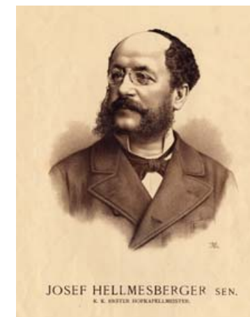
Joseph Hellmesberger senior Světlotisk / Phototypy, nedatováno / undated