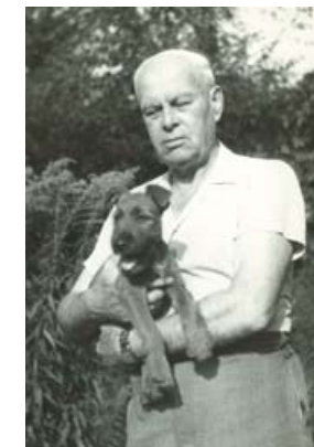
Otakar Šourek Fotografie / Photograph, 1954 NM-ČMH-MAD, č. př. / Acquisition No. 88/98