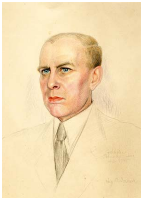
Portrét Otakara Šourka od Zdeňky Burghauserové / Portrait of Otakar Šourek by Zdeňka Burghauserová Kolorovaná kresba tužkou / Coloured pencil drawing NM-ČMH-MAD, č. př. / Acquisition No. 340/57, inv. č. 11 / Inventory No. 11