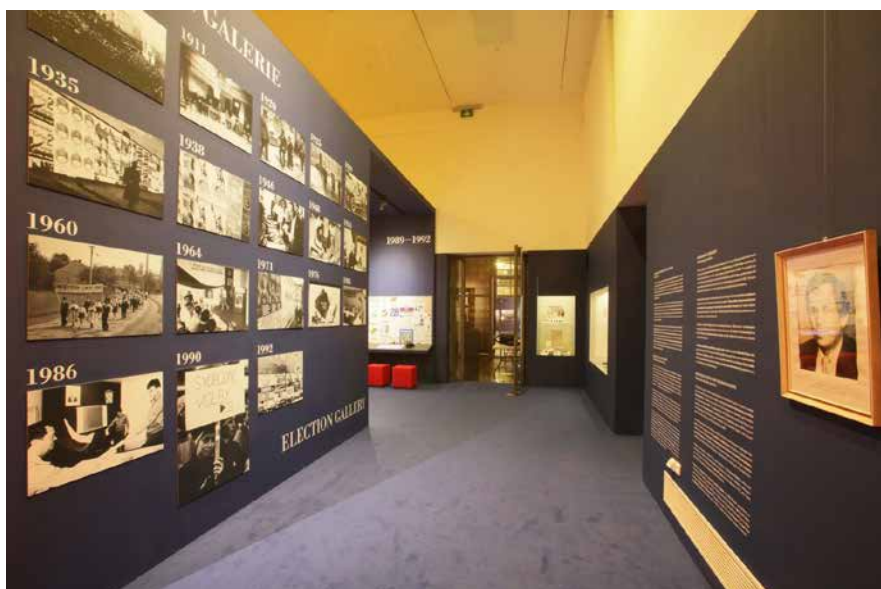
Obr. 1. Pohled do závěrečné části výstavy „Parlament!“.