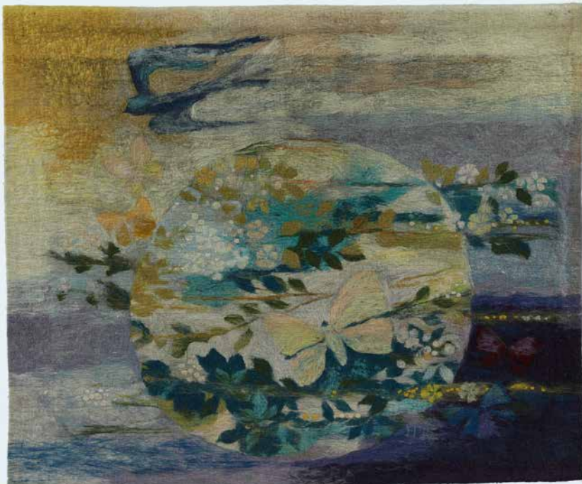
Obr. 3. Tapiserie Kvetoucí země z budovy Federálního shromáždění od Hany Blažkové-Charouzové, inv. č. H8-24503.