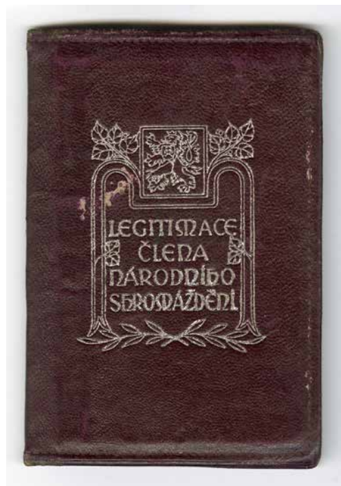
Obr. 6. Vnější obal senátorské legitimace Františky Plamínkové, f. F. Plamínková, inv. č. 2.