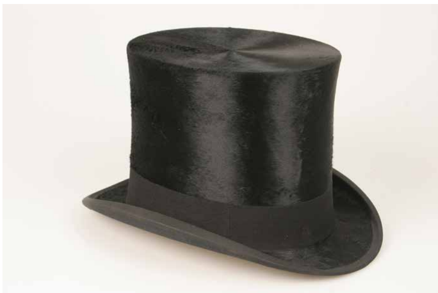
Obr. 9. Jeden z cylindrů Karla Kramáře uchovávaných ve sbírkách Národního muzea, inv. č. H2-54382.

Ve sbírkách Národního muzea nalezneme taktéž řadu různých soch a bust vyrobených z rozličných materiálů (zejména kovy, sádra), které prezentují politiky. Některé ze soch jsou trvale alokovány v prostorách Národního muzea, další jsou vystaveny v expozicích či uloženy v muzejních depozitářích.