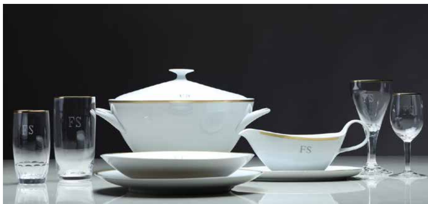
Obr. 4. Jídelní servis a sklenice z budovy Federálního shromáždění, inv. č. H8-23448 a H8-23449.

svolání Říšské rady do Vídně v únoru 1861 či vyhlášení prosincové ústavy v roce 1867. Na pamětní medaili zapsané pod inventárním číslem H5-55802 je připomenuta také Ústavní listina Československé republiky. Prvotní Prozatímní ústavu nahradila s účinností od 6. března 1920 nová ústava, která zůstala i přes mnohé politické změny v platnosti až do doby krátce po politickém převratu v roce 1948. Faksimile Ústavních listin z let 1920 a 1948 v reprezentativním, ale zjednodušeném provedení, byly pro Národní muzeum vyrobeny v roce 1987 společně s dalšími sedmnácti významnými dokumenty (především mezinárodními smlouvami). Vyrobil je v dané době pro expozici nových dějin slovenský specialista na rukopisy Ivan Galamboš.