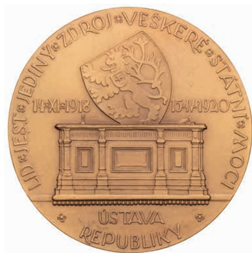
Obr. 5. Pamětní medaile připomínající též Ústavu republiky, inv. č. H5-55802.

Všechny výše uvedené prostory byly spojené s vykonáváním parlamentní činnosti. Její klíčová část spočívala v podílu na tvorbě zákonů. Ve sbírkách Národního muzea se nachází řada předmětů připomínajících vydání ústav – základních zákonů státu. Například v Numismatickém oddělení NM je v souvislosti s nimi zapsána řada pamětních medailí z 19. století. Medaile zde připomínají vydání konstituce z roku 1848, vydání říjnového diplomu v roce 1860 a zářijového manifestu v roce 1865,