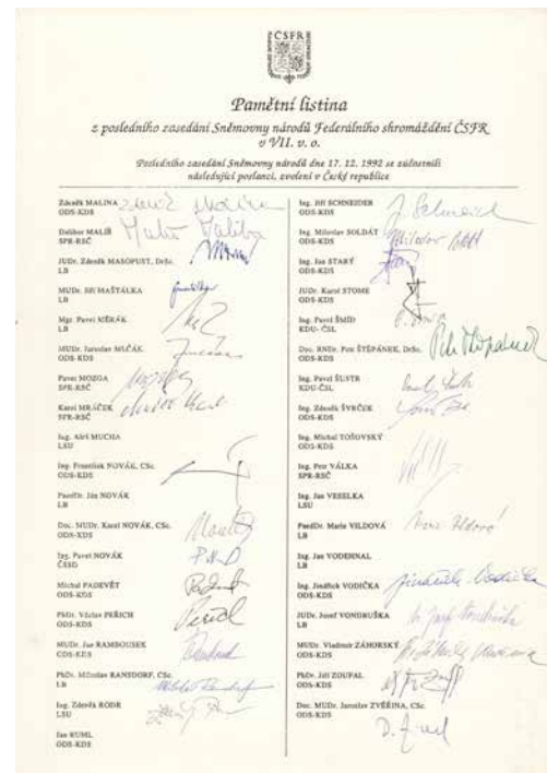
Obr. 7. Pamětní listina na poslední zasedání Sněmovny národů, jeden ze čtyř listů s podpisy poslanců, inv. č. H8p-46I2014.