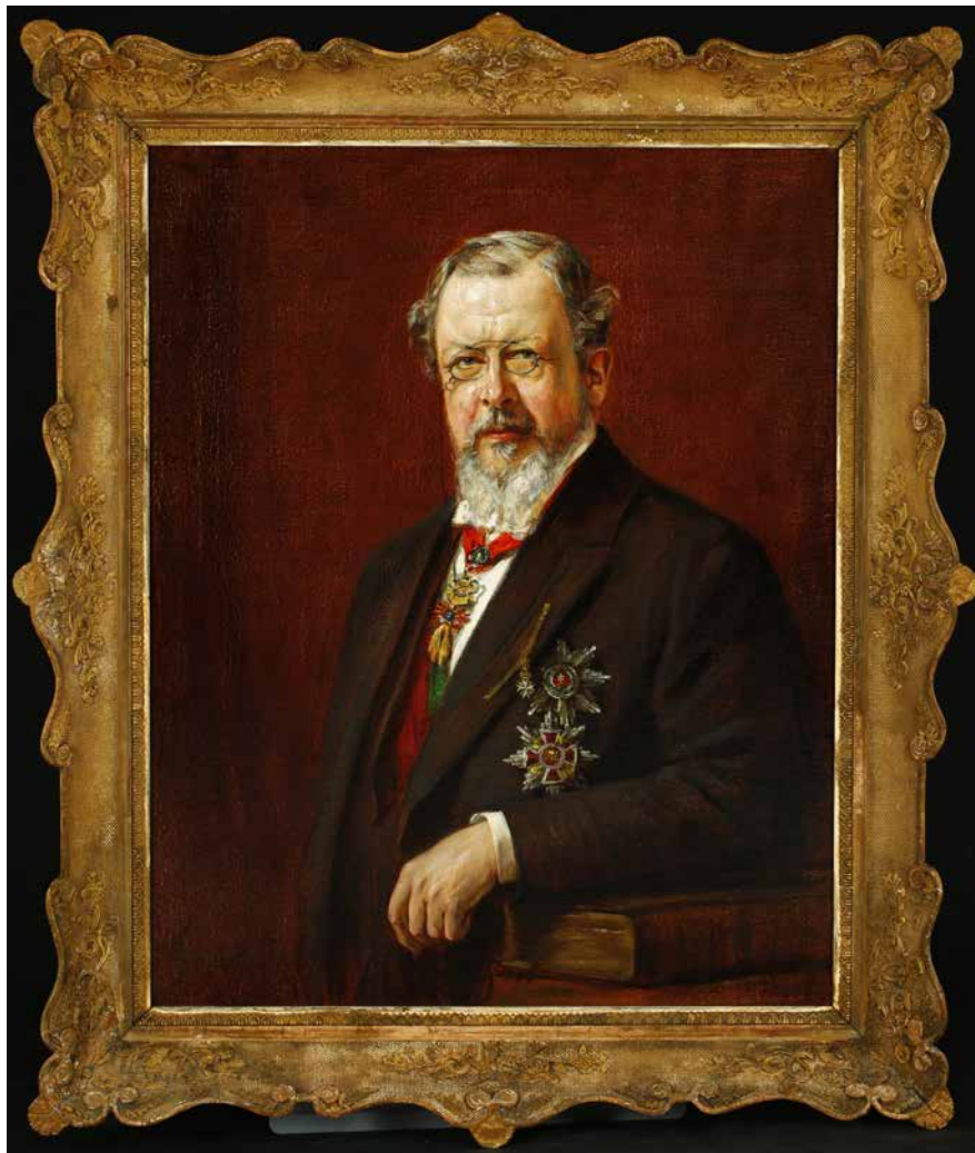
Obr. 8. Portrét nejvyššího maršálka – Jiří Kristián kníže Lobkowitz, inv. č. H2-60788.

Národní muzeum má ve svých sbírkových fondech rovněž značné množství předmětů ke členům parlamentních komor, které se často bezprostředně netýkají výkonu jejich politické činnosti. Mezi ně lze zařadit jejich vizuální zobrazení na fotografiích a různých tiskovinách, obrazech či sochách (bustách). Díky dlouhodobé práci bývalého kurátora fondu portrétů na Oddělení starších českých dějin Lubomíra Sršně se tato sbírka i v posledních desetiletích značně rozrostla a je pečlivě zpracována. Veřejnosti ji zpřístupnil formou tří knižních celků o malovaných portrétech. 24 Portréty zobrazují mnohé významné osobnosti politiky 19. i 20. století. Vyobrazují např. Františka Palackého, Františka Ladislava Riegera, Julia Grégra a další osobnosti. Již zmíněným unikátem je soubor sedmi obrazů nejvyšších maršálků Království českého, kteří předsedali českému zemskému sněmu v letech 1861–1913. Je na nich zobrazen Albert z Nostic-Rienecku,