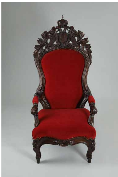
Obr. 2. Křeslo místodržícího z českého zemského sněmu, inv. č. H2-17639.

Ve sněmovně stálo pod portrétem Františka Josefa I. masivní křeslo nejvyššího zemského maršálka – předsedy sněmu. Toto křeslo evidované ve sbírkách Oddělení starších českých dějin Národního muzea pod inventárním číslem H2-17638 bylo zhotoveno rovněž při vybavování sněmovny v roce 1861. Je vysoké 167 cm a řezbářsky bohatě zdobeno. Na nástavci jeho opěradla se nachází znak s českým lvem a svatováclavskou korunou. Podle evidenční karty se dostalo do sbírek muzea jako dar od Zemského výboru v Čechách. V roce 1987 bylo restaurováno Miroslavem Pertem, přičemž čalounění rudým sametem obstaralo Ústředí uměleckých řemesel. V tomtéž roce se křeslo maršálka přesunulo do dlouhodobé expozice Národního muzea na zámku ve Vrchotových Janovicích, kde je stále k vidění i v současnosti. Křeslo zhotovené