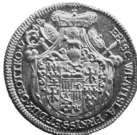
• obr. 2