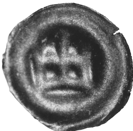
• Dutý halěř s korunou, nález Svrčovec 2001