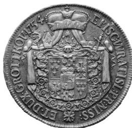
• obr. 6