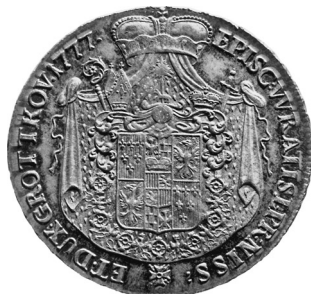
• obr. 14