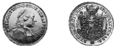
• obr. 13