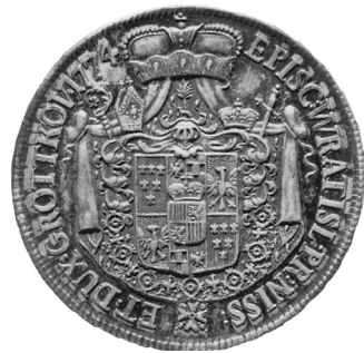
• obr. 11