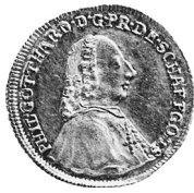
• obr. 3