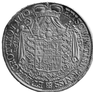
• obr. 8