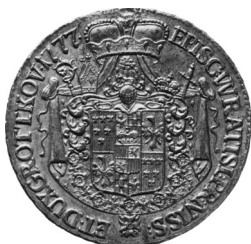
• obr. 15