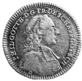
• obr. 4