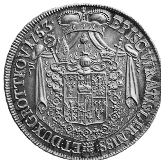
• obr. 5