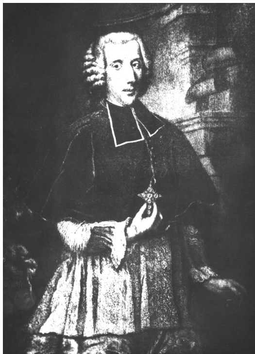
• obr. 16 – portrét biskupa Filipa Gottharda Schaffgotsche

Pro aversní stranu bylo zřejmě použito razidlo 1/2 tolaru 1770 bez značky, pro reversní stranu bylo zhotoveno, jako u tolaru 1777 bez značky, razidlo nové. Zjištěn jeden exemplář, vyobrazená a popsaná mince je uložena ve Staatliche Museen zu Berlin v Berlíně. Průměr 33,0 mm; hmotnost 14,01 g; hrana Laubrand; inv. č. 26 F/1904