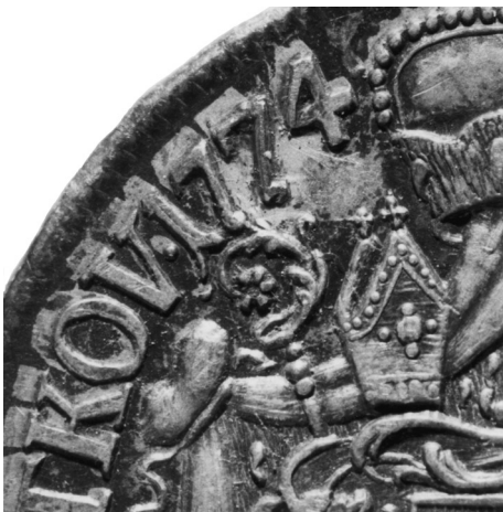
• obr. 12 – detail přerytí razidla z 1754 na 1774

Průměr 34,0 mm; hmotnost 14,61 g; hrana Laubrand; inv. č. Altbestand