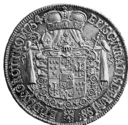
• obr. 7

Zjištěn jediný exemplář, vyobrazená a popsaná mince je uložena v Kunsthistorisches Museum ve Vídni.