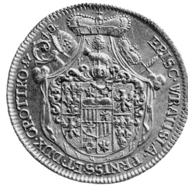
• obr. 1

runkou. Z přílby splývají (červeno-stříbrná) přikryvadla. Za štítem vpravo berla závitěm dovnitř a mitra, vlevo knížecí čepice a meč. Vše spočívá na knížecím plášti s knížecí čepicí.