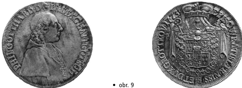
• obr. 9

Existence neověřena, cituje F. Friedensburg pod č. 2783 a E. Kopicki pod č. 667/3 (průměr 33,0 mm, hmotnost 14,4 g). Mince je údajně uložena ve sbírkách Muzea Narodowego ve Varšavě.