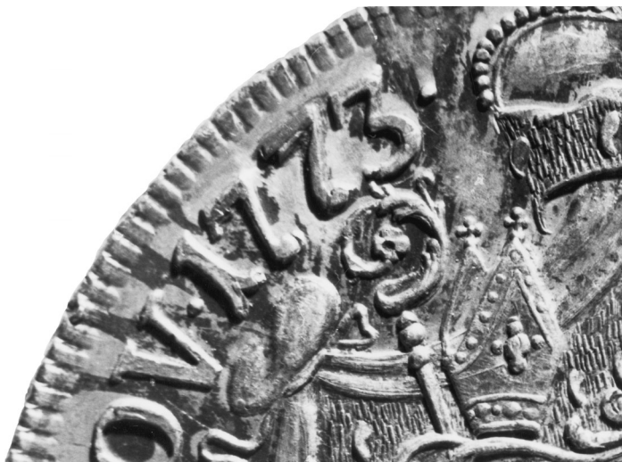
• obr. 10 – detail přerytí razidla z 1753 na 1773

Průměr 42,0 mm; hmotnost 29,17 g; hrana Laubrand; inv. č. Altbestand