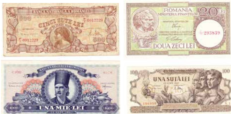
● 1: Papirová platidla z reformy 1947.

Každý z nominálů 20, 100, 500 a 1000 lei vzoru 1947 byl tedy tištěn jinde, z čehož vyplývá i jejich grafická a ideová nesourodost: