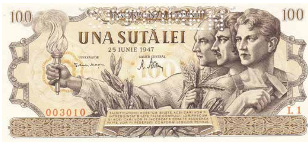
●□5: Perforace SPECIMEN z tiskárny NB S.

Za zmínku rovněž stojí bankovní vzory. Ty jsou v souladu s rumunskou praxí na tzv. anulátech ( číslo tvořené šesti nulami) s červeným diagonálním p e-tiskem SPECIMEN. Existuje několik exemplářů s perforací SPECIMEN, což byla praxe československé emisní banky uplatňovaná jak na skutečných bankovních vzorech, tak i na exemplářích výhradně československých bankovek prodávaných pro sběratelské účely. V případě rumunské bankovky byla perforace provedena u několika málo kusů na běžných sériích; tyto exempláře sloužily pouze pro dokumentární potřeby tiskárny NB S a neznámo jakými cestami se dostaly do rukou sběratelů.