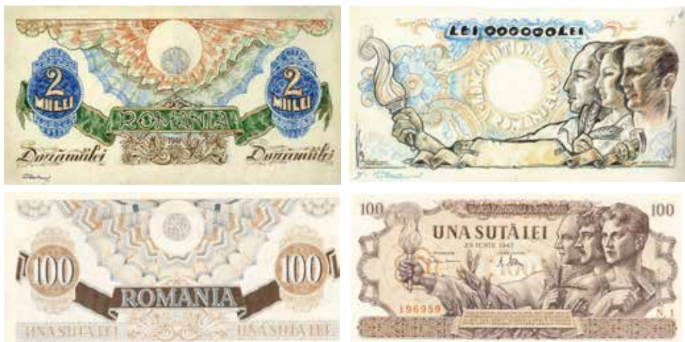
●□2: Návrhy a realizace.

Reprodukujeme návrh od rumunského výtvarníka, jakož i výslednou podob u bankovky, abychom mohli pln ě ocenit perfektní grafické zpracování: