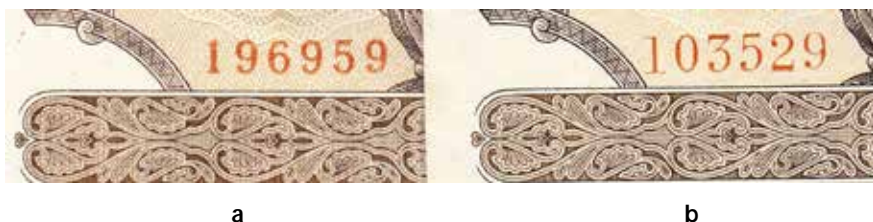
●□3: čísla e. a) emise červen a srpen; b) emise prosinec.

Dobrý pozorovatel jistě také zjistí použití jiného čísla e. Zde se naskytá určitá nejasnost, kterou dosažitelné archivní prameny vysvětlují jen málo. Pro tuto emisi si BNR v Praze zajistila zápis ku dalších 50 kusů čísla stejného typu, jaké byly použity u prvních dvou emisí. Jediná relevantní zmínka o jejich dodávce je v zachované žádosti o vývozní povolení z 11. září 1947: „50 kusů tlačítkových sazbových číselnic šestimístných výroby firmy Klepač, Kolín.“ Poznámka u žádosti o vývozní povolení dokládá, že přístroje byly zapůjčeny zdarma na dobu jednoho roku. Čísla e byly vráceny na jaře 1948, kdy byl ukončen tisk nominálu 100 lei 1947. Je zřejmé, že nebyl dodržen požadavek, aby to byly čísla e stejného typu jako na předchozích dvou emisích. Bezislíc odpovídá číslům Bradbury & Wilkinson, použitým na nominálech 100, 500 a 1000 Kč s tzv. londýnské emise, neodpovídají však rozměry, a jsou bezárky za tetičkující. Tento číslík nebyl použit na žádné československé bankovce. Nezbývá než předpokládat, že kolínská firma Klepač vyrobila k tomuto účelu zcela nový typ čísla e. Nelze to však prokázat na základě archivních dokumentů, protože veškerý archiv této firmy byl zničen, nebo její znárodněná nástupkyně nepovažovala za užitečné a žádoucí ho zachovat.