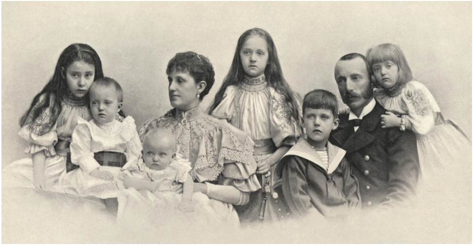
Obrázek 2 – Rodina arcivévodkyně Marie Terezy. Wikimedia Commons, https://commons.wikimedia.org/wiki/Category:Archduchess_Maria_Theresa,_Princess_of_Tuscany#/media/File:Karl_Stephan_Austria_1860_1933_family1896.jpg

na vyjížděku. Přes 24 hodin jsem o Východě vůbec nic nevěděl, dnes v 10 přišel telegram ze Zadaru: ‚Dorazili jsme, prosím o zprávy o malé‘. Samozřejmě jsem ihned odpověděl, od té doby, teď je 10 večer, zase nevím nic. Malé arcivévodkyni se chvála Bohu daří znamenitě a ani jinak se nic nepříhodilo, ale co kdyby to tak nebylo?“ 36