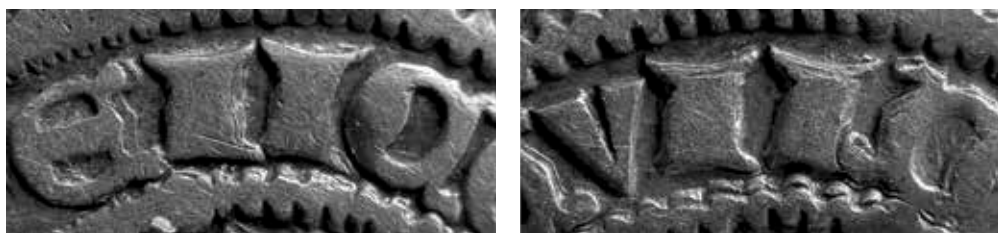
●□1: Detail písmene N ve slově WENCEZLAVS a ve slově SECVDVS.