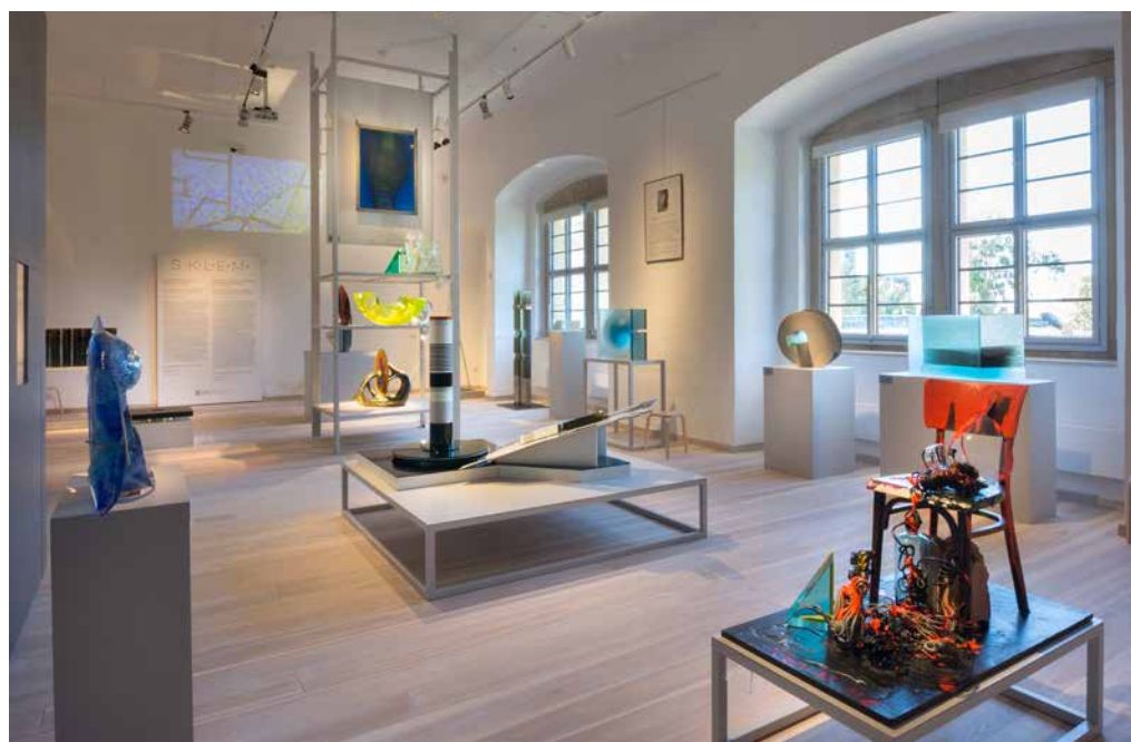
Expozice S.K.L.E.M.: první sál. Autor: Luděk Vojtěchovský.

Základní prostorové a časové rozdělení expozice S.K.L.E.M. Autor: GEM architects, s. r. o.