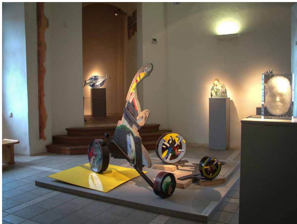
Pohled do bývalé expozice skla Východočeského muzea v Pardubicích s volně instalovanými ukázkami ateliérové tvorby.