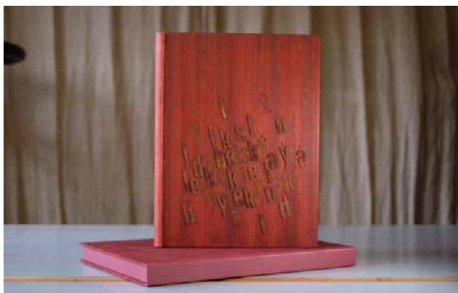
Obr. 10. Harold Rolseth: Ďábelský koktejl . Polokožená vazba z oázní koziny na hlubokou drážku, tzv. Bradel. Padouk a třešňové dřevo, MDF deska, řezání a gravírování. Vazba Ateliér Krupka 2021.

u Prahy, ukazující vizuálně atraktivní proces čerpání ručního papíru, sazby textu a tisku. Výstava je digitálně zpracována do 3D prezentace umožňující podrobnější náhled na několik vybraných knižních vazeb a ilustrační materiál, jakož i celkový pohled do výstavy. Digitalizovaná výstava je přístupná na webových stránkách Národního muzea. 1 Jako doplněk k výstavě jsou na portálu eSbírky.cz zveřejněny pro vášnivě šachisty dvě digitalizované autorské knihy Lubomíra Krupky – Šachová poezie a Šachová partie , což je bibliofilsky zpracovaná šachová hra Anderssenova proti Kieseritzkému z roku 1851.