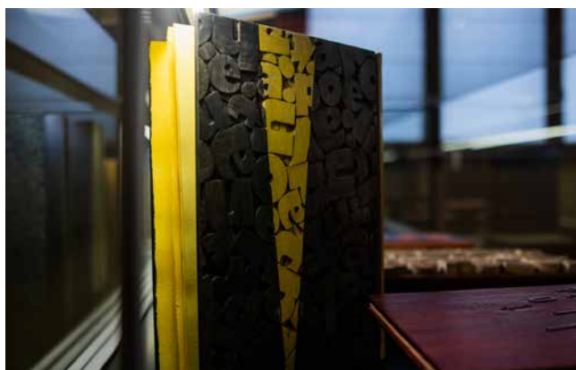
Obr. 1. Edgar Allan Poe: Havran . Detail knižní tzv. sendvičové vazby na hlubokou drážku, bambusová dýha, MDF deska. Vazba Ateliér Krupka 2021.

V komorním výstavním sále Knihovny Národního muzea v Historické budově Národního muzea se dne 19. ledna 2023 otevřela pro širokou veřejnost výstava prezentující špičku současné české bibliofilské produkce a umělecké knihařiny, jedinečnou tvorbu Ateliéru Krupka sídlícího v Úvalech u Prahy. Výstava ukázala ta nejzajímavější díla z posledních let, jejichž autory je manželská dvojice uměleckých knihařů Miroslava a Lubomír Krupkovi, kteří tvoří již více než třicet let pod značkou Ateliér Krupka (LMK). Celkem bylo možné na výstavě spatřit na třicet pět uměleckých knižních vazeb a autorských knih instalovaných ve vitrínách. Na stěnách v jedenácti rámech pak dominovaly archy bibliofilských tisků, tedy ukázky zajímavých ilustrací a typograficky originální sazby na tónovaných ručních papírech.