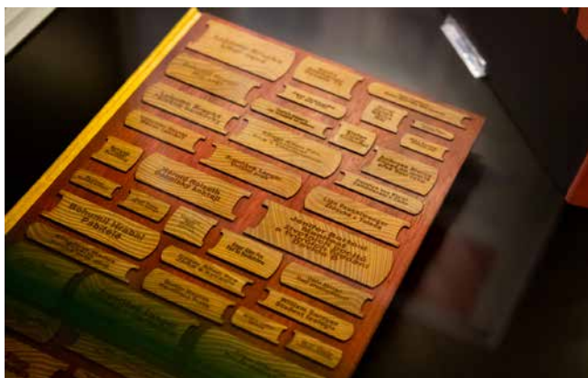
Obr. 2. Stefan Zweig: Knihomol . Detail polokožené knižní vazby z oázní koziny na hlubokou drážku, tzv. Bradel. Akátové dřevo, padouk, MDF deska, gravírování. Vazba Ateliér Krupka 2021.