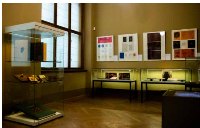
Obr. 7. Pohled do výstavy Knižní vazby = ? Ateliér Krupka. Otazník v názvu evokuje nejistou budoucnost oboru umělecké knižní vazby.

knihy. Manželé Krupkovi svou Liber Aqua láskyplně nazývají „akvarijská kniha“, na výstavě byla prezentována skutečně v akváriu naplněném destilovanou vodou.