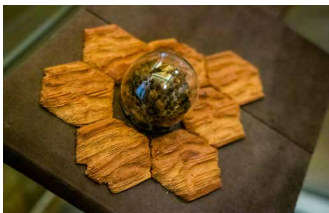
Obr. 6. Vosí kniha . Detail autorské knihy – pouzdra s fragmenty tlejícího dřeva a části vosího hnízda v baňce z foukaného skla. Ateliér Krupka 1990.