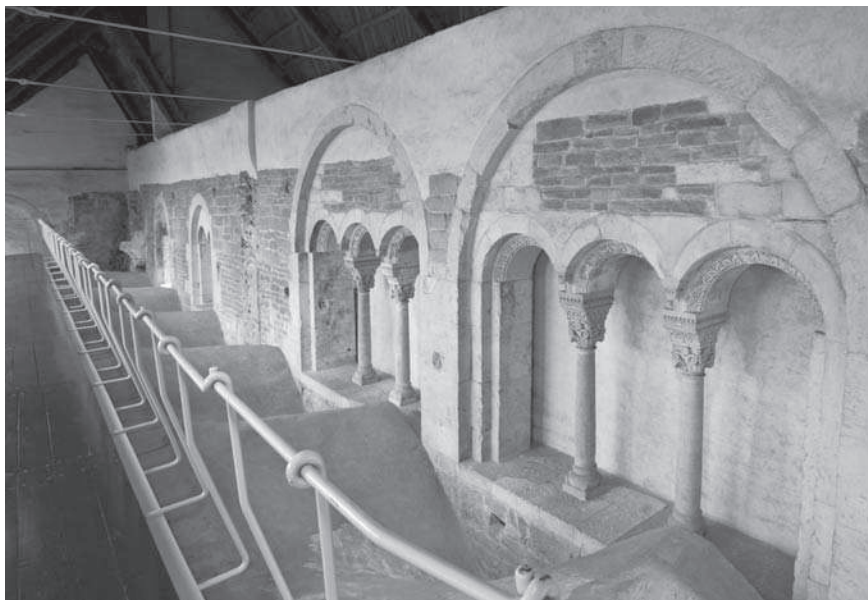
Obr. 3: Arcidiecézní muzeum Olomouc. Jeho součástí je také románský biskupský palác.

20 HLOBIL, Ivo (ed.) Ultimi Fiori del Medioevo. Dal Gotico al Rinascimento in Moravia e nella Slesia. Olomouc, 2000. HLOBIL, Ivo (ed.) The Last Flowers of the Middle Ages. From Gothic to the Renaissance in Moravia and Silesia. Olomouc, 2000.