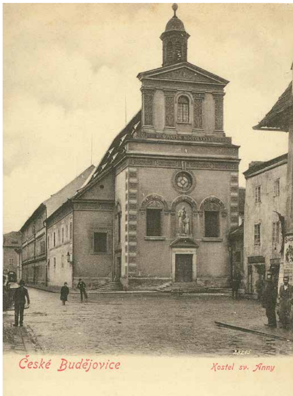
●□1: Bývalý kapucínský kostel sv. Anny na rohu dnešních ulic Karla IV. a Kněžské v Českých Budějovicích. Pohlednice z doby kolem roku 1900.