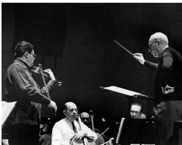
Josef Suk s dirigentem Georgem Szellem / Josef Suk with the conductor George Szell (New York, 1964)

Fotografie ze sbírky Josefa Suka (soukromý majetek) / Photograph from Josef Suk's collection (private property)