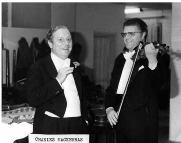
Sir Alan Charles Mackerras a / and Josef Suk (70. léta 20. století) / (1970s)

Fotografie ze sbírky Josefa Suka (soukromý majetek) / Photograph from Josef Suk's collection (private property)