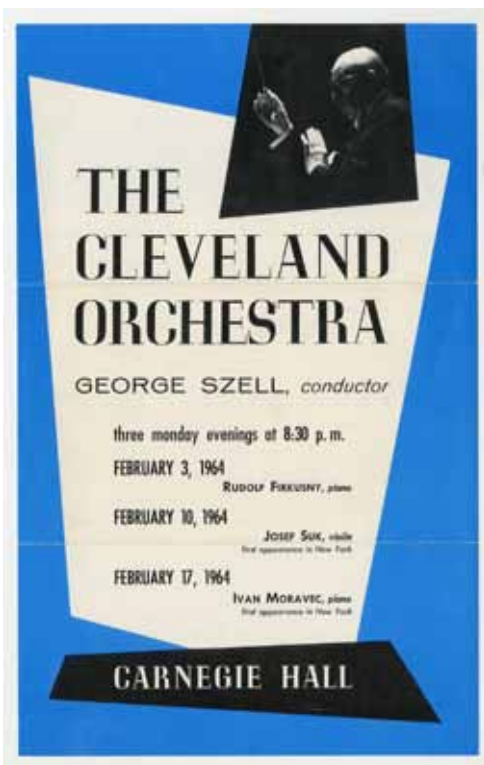
Plakát koncertu Josefa Suka v Carnegie Hall (New York, 10. 2. 1964) / Poster for Josef Suk's concert in Carnegie Hall (New York, 10 Feb. 1964) NM-ČMH-HHO S 272

Výstava Josef Suk. Housle – můj osud. Pohled do výstavního prostoru / Exhibition Josef Suk. The Violin, My Destiny. View into the exhibition space