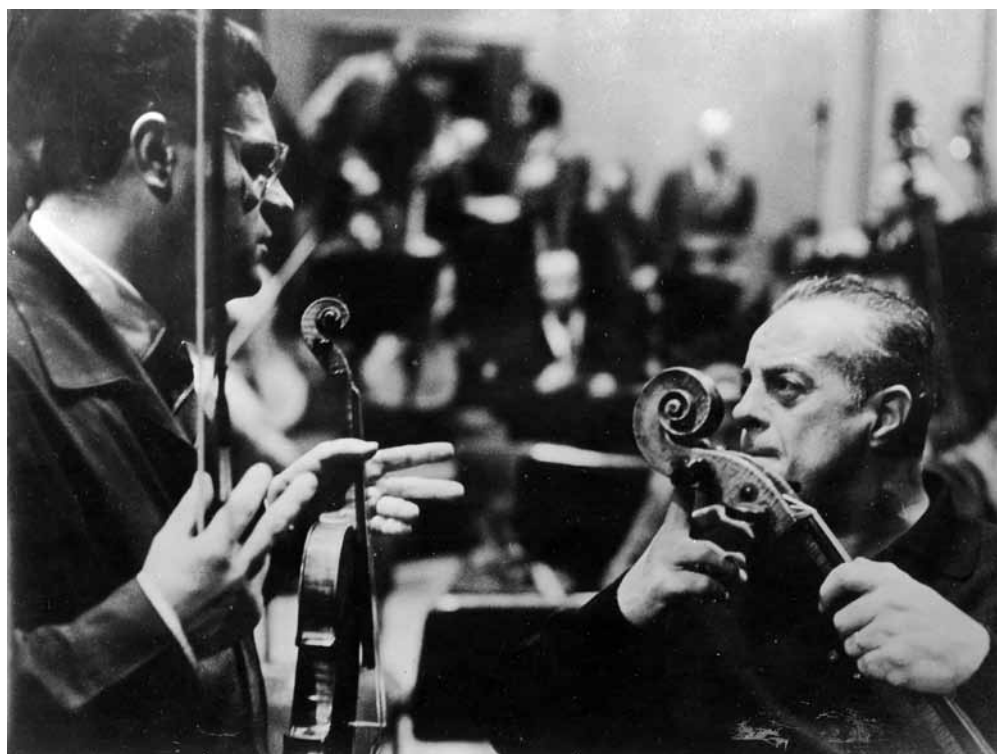
Josef Suk s violoncellistou André Navarrou (60. léta 20. století) / Josef Suk with cellist André Navarra (1960s)

In the latter half of the twentieth century, Josef Suk stood alongside Váša Příhoda as one of the world's most famous Czech violinists. Paradoxically, today there are just a few encyclopedia articles about him, and no scholarly monographs. The new materials obtained by the Czech Museum of Music offer further possibilities for research. The purpose of the exhibition was to draw attention to this material and to remind visitors of the importance of the violinist Josef Suk in the history of the performing arts in this country and worldwide.