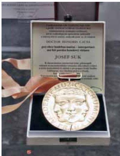
Zlatá medaile Doctor honoris causa , čestný doktorát Akademie múzických umění v Praze (2003) / Gold medal of the Doctor honoris causa degree , an honorary doctorate from the Academy of Fine Arts in Prague (2003) Soukromá sbírka / Private property