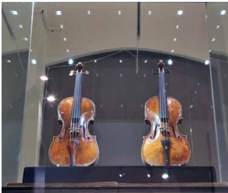
Housle zvané Libon (vyrobil Antonio Stradivari, Cremona, 1729), vpravo housle zvané Princ Oranžský (vyrobil Giuseppe Guarneri del Gesù, Cremona, cca 1744) / Violin called the "Libon" (made by Antonio Stradivarius, Cremona, 1729), on the right the violin called the "Prince of Orange" (made by Giuseppe Guarneri del Gesù, Cremona, ca. 1744) Nástroje, na které hrál Josef Suk / Instrument played by Josef Suk NM-ČMH-OHN E 2860, E 2859