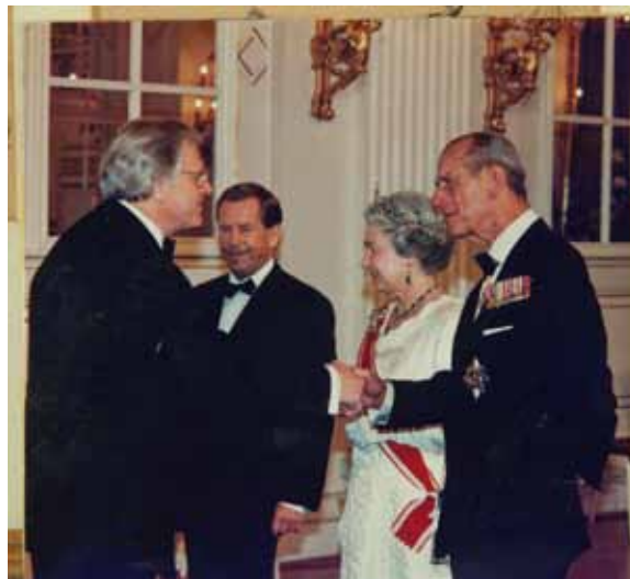
Josef Suk s anglickou královnou Alžbětou II. jejím manželem princem Philipem a prezidentem Václavem Havlem ve Španělském sále Pražského hradu (1996) / Josef Suk with British Queen Elisabeth II, her husband Prince Philip, and Czech President Václav Havel in the Spanish Hall of Prague Castle (1996)