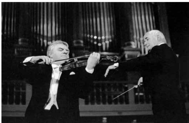
Josef Suk s dirigentem Václavem Neumannem (80. léta 20. století) / Josef Suk with the conductor Václav Neumann (1980s)

Kromě hudby tvořící kulisu v celém výstavním prostoru si mohl návštěvník poslechnout Sukovy nahrávky asi dvou desítek skladeb českých i světových autorů (např. Sukovo houslové sólo z Pohádky , Trio c moll a Čtyři kusy pro housle a klavír , Smetanova dueta Z domoviny , Janáčkovu Sonátu pro housle a klavír , Martinův Houslový koncert č. 1 , Bergův