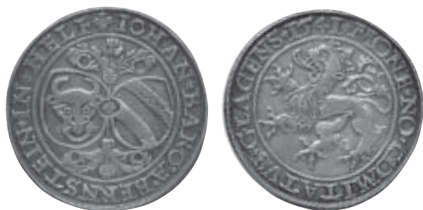
Kladsko, Jan z Pernštejna (1537–1548), Kladsko, neznačeno, tolar 1541

Na všech dukátových, tolarových a grošových mincích, které vycházely z perňštejnské kladské mincovny, vidíme na aversu dva znaky, vlevo z hlediska pozorovatele perňštejnský a vpravo kladský, s rostlinným motivem mezi nimi a s opisem připomínajícím vydavatele: IOHAN BARO A BERNSTEIN IN HELF (Jan svobodný pán z Pernštejna na Helfštejně), na reversu pak, jak již bylo řečeno, je vyobrazen český lev. Ve zjednodušené podobě to platí i pro haléře: na líci nacházíme perňštejnský štítek obklopený písmeny I B A B a na rubu lva. Všechny perňštejnské ražby