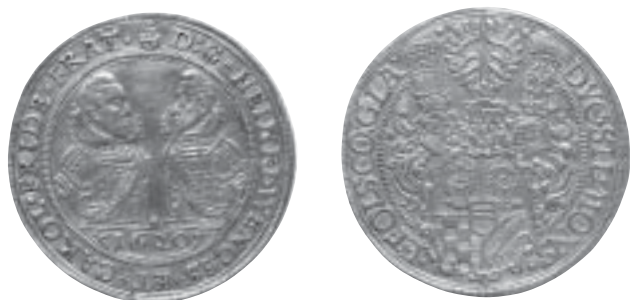
Minsterberk-Olešnice, Jindřich Václav a Karel Bedřich (1617–1639), Olešnice, Burkhardt Hase, 5dukát 1620 Národní muzeum, inv. čís. H5-33 905; AV – 41,0 mm – 17,13 g