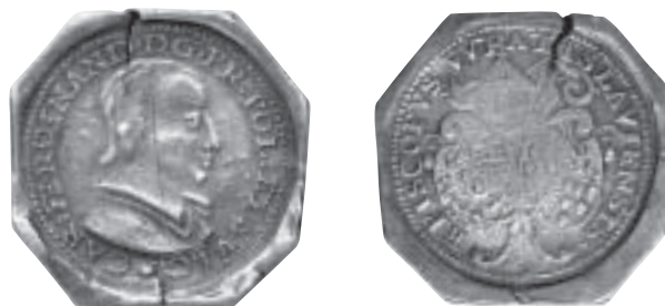
Nisa – Vratislav, biskupství, Karel Ferdinand (1625–1655), Nisa, 8-hranná tolarová klipa 1639 Národní muzeum, inv. čís. H5-111 346; AR – 28,1 mm – 26,08 g

v nisské mincovně vybičeny zlaté a stříbrné mince v celé škále peněžních nominálů, k nimž pak od roku 1631 přidal biskup Karel Ferdinand (1625–1655) i ražby v podobě vzácných čtyř-, šesti- a osmihranných klip ze zlata a stříbra. Dvě tyto osmihranné tolarové klipy chováme i my v našich numizmatických fondech.