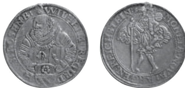
Rychlebsko, Vilém z Rožmberka (1552–1592), Rychleby, neznačeno, tolar 1587 Národní muzeum, inv. čís. H5-35 695; AR – 42,4 mm – 28,27 g