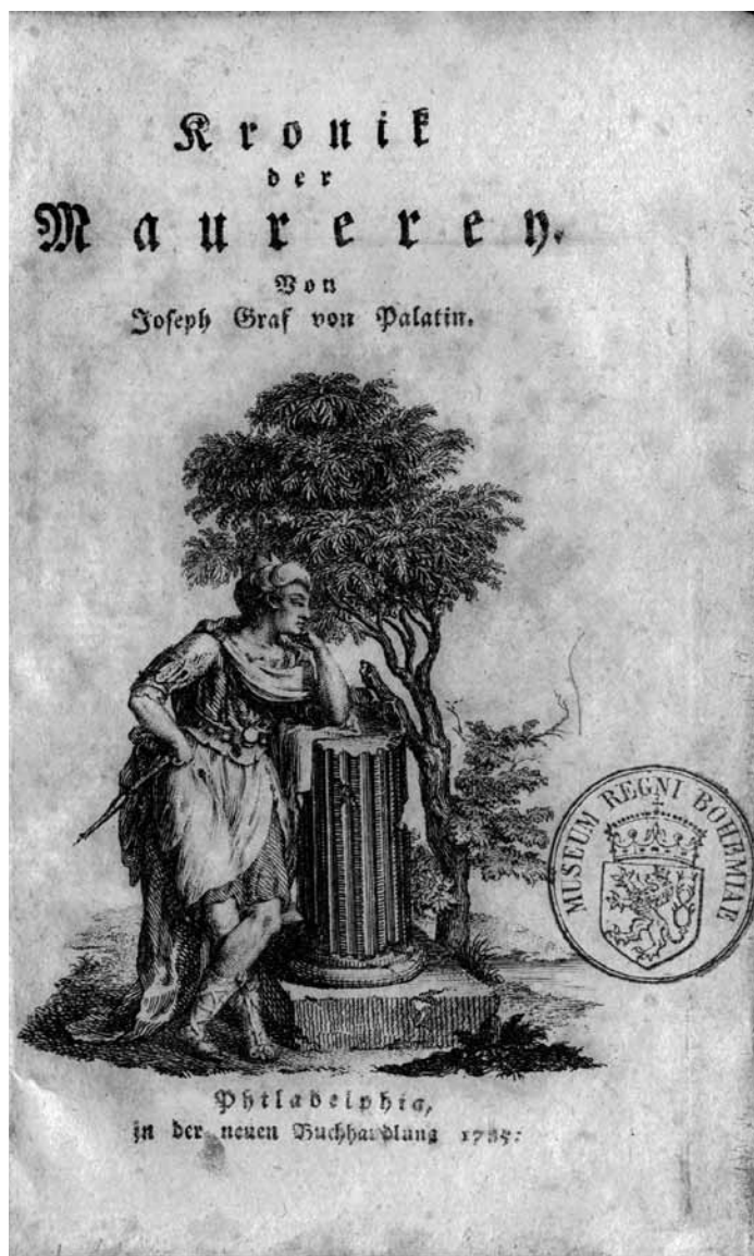
Josef hrabě von Palatin, Kronik der Maurerey, Philadelphia /Praha/, in der neuen Buchhandlung, 1785

Knihovna NM, fond Zednářská knihovna sg. 121.