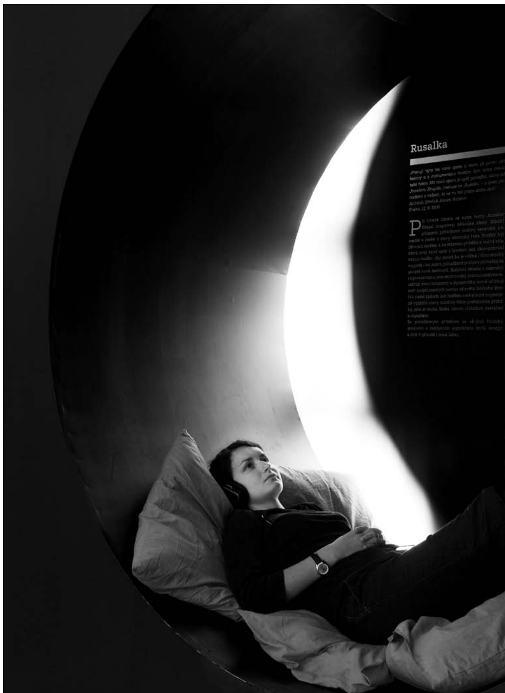
Výstava Antonín Dvořák / The Exhibition Antonín Dvořák Odpočinek při poslechu Rusalky / A rest while listening to Rusalka Fotografie / Photograph, Alena Krásná