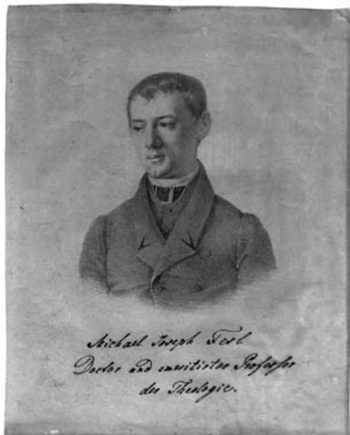
Obr. 7 M. J. Fesl na litografii z přelomu let 1824/1825