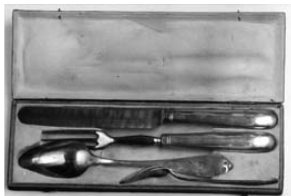
Obr. 2 Příbor z Feslovy pozůstalosti