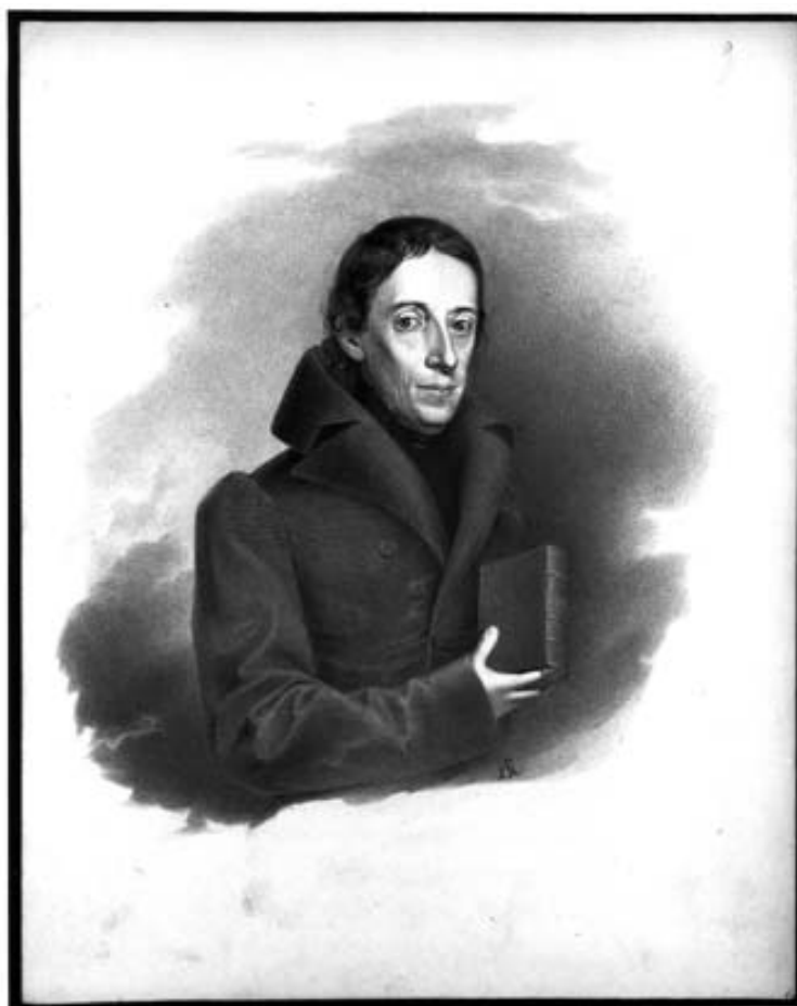
Obr. 3 Portrét B. Bolzana od Antona Grusse z r. 1831 z Feslovy pozůstalosti