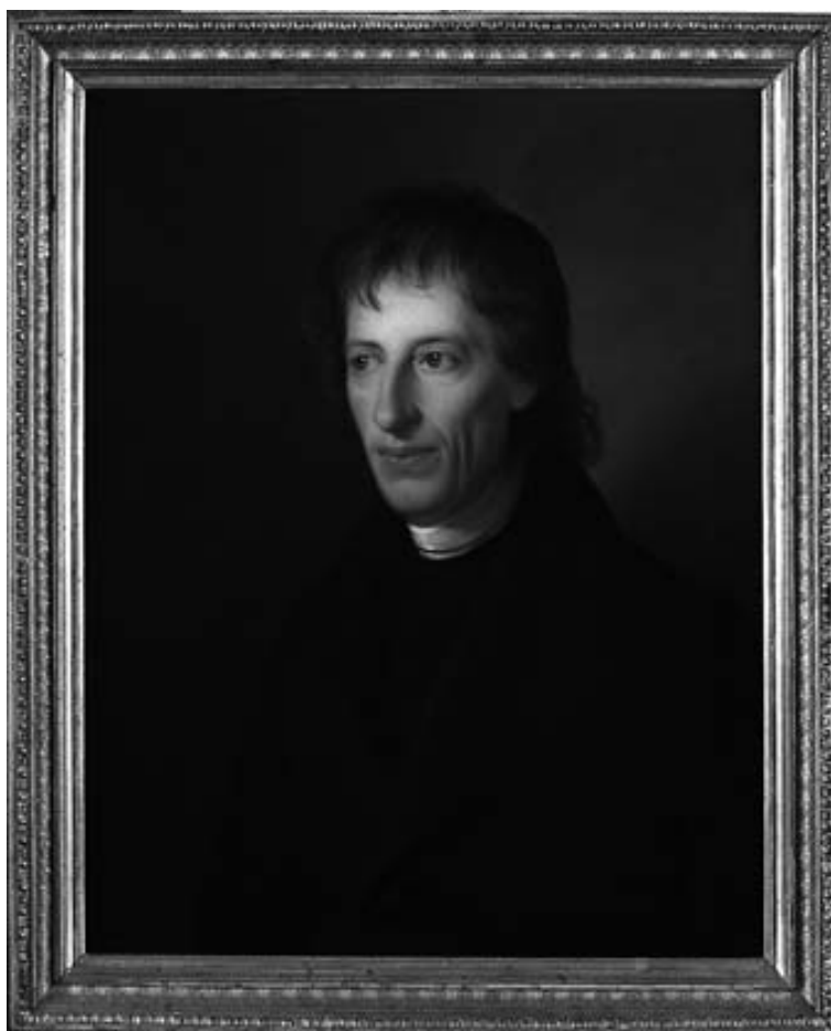
Obr. 8 Portrét B. Bolzana od Heinricha Hollpeina z let 1839–1840