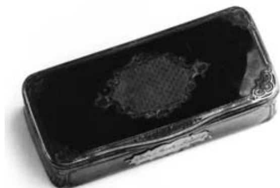
Obr. 1 Tabatěrka z Feslovy pozůstalosti

Obr. na str. 186 dole: Portrét ThDr. Michala Josefa Fesla (1788–1864), Antonín Lhota (2. 1. 1812, Kutná Hora – 9. 9. 1905, Volyně), Praha, květen – prosinec 1868, olej na plátně 104,1 x 81,8 cm, nesignováno. Modifikovaná kopie podle oleje od Jos. Bindera, zhotovená na zakázku Muzea Království českého. Mladší dubový rám s nástavcem a jmenovkou dodal V. Šponar r. 1895. Rozměry rámu včetně nástavce 129,4 x 92,5 cm, jmenovka má 20,3 x 37,8 cm. Národní muzeum, inv. čís. H2-11 804/a-d.