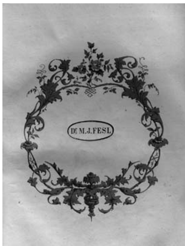
Obr. 6 Razítko označující knihy z Feslovy pozůstalosti