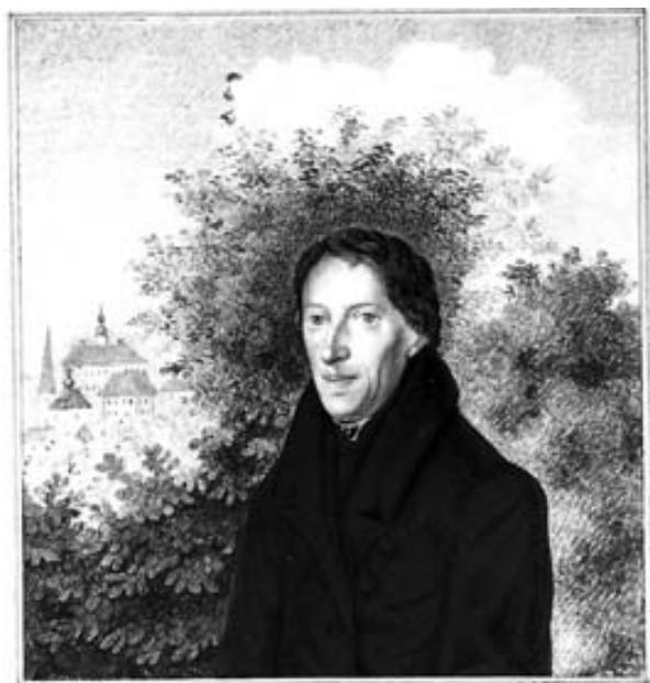
Obr. 4 Portrét B. Bolzana od Karla Hoffmanna z r. 1840 z Feslovy pozůstalosti