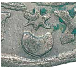
●□1: Detail mincmistrovské značky.