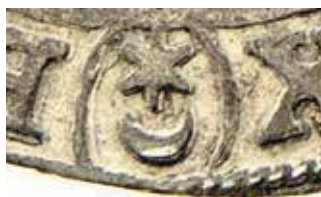
●□3: Detail mincmistrovské zna ky.

Ex: ČNS pobočka Praha, 54 (121). aukce (dne 17. 9. 2011), položka č. 1003.