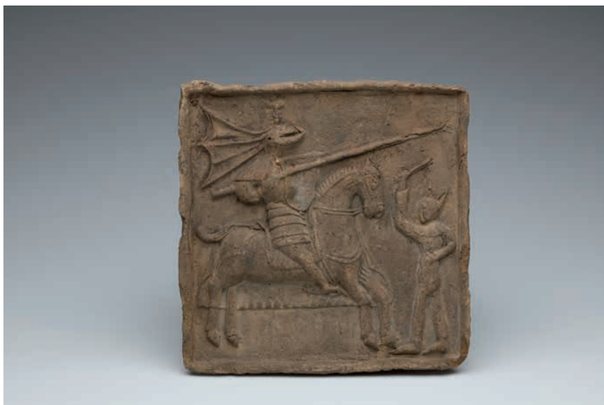
Turnajová scéna, rytíř na koni, před ním stojí šašek. Čechy, 2. polovina 15. století. Sbíрка Národního muzea.

55 BŮŽEK, Václav. Ferdinand Tyrolský mezi Prahou a Innsbruckem. Šlechta z českých zemí na cestě ke dvorům prvních Habsburků. České Budějovice: Historický ústav Filozofické fakulty Jihočeské univerzity, 2006, s. 179.