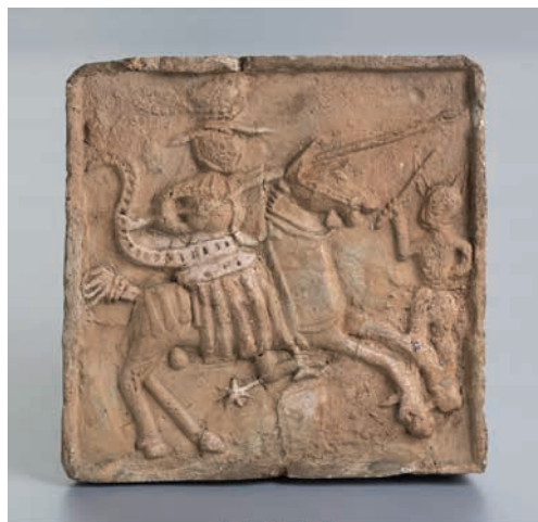
Komorový kachel s turnajovou scénou: jezdec na koni s dřevcem a štítem, na hlavě šišák s vlajčí stuhou, vlevo šašek. Čechy, polovina 15. stol. Muzeum hlavního města Prahy, foto I. Kyncl.

Cílem této práce bude zmapovat místa, kde se rytířské hry v Praze konaly, jejich chronologii a architekturu s širším přesahem k historii fenoménu. Vycházet