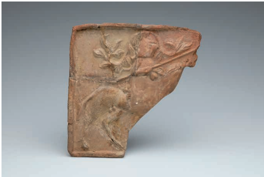
Zlomek reliéfního kachle s motivem turnajové scény. Čechy, 15. století. Sbirka Národního muzea.

Následující staletí je, co se týče míst, konzervativnější. Nejvyužívanější lokalitou byl Staroměstský rynek. Stánky, které se zde obvykle nacházely, byly před těmito příležitostmi vždy odklizeny a minimálně porybná bouda, která stávala na náměstí směrem k Dlouhé třídě, musela roku 1510 ze stejného důvodu zmizet úplně. 38 Ačkoliv se doba klasické rytířské kultury chýlila ke konci (především vlivem narůstající role pěších bojovníků), obliba turnajů neklesala, ba naopak. Poněkud se však změnila jejich forma, která směřovala k větší bezpečnosti a určité teatralnosti. 39 Nejběžnějším typem turnaje se stala kvintána a „honění ke kroužku“, při nichž se rytíři snažili trefit kopím terč, pytel s pískem, maškaru či zavěšený kroužek. Původně se jednalo o cvičení předcházející klání ve šraňcích.