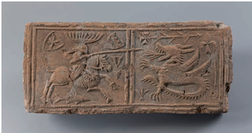
Cihelný reliéf s motivem jezdce bojujícího s drakem. Praha, 14. století. Muzeum hlavního města Prahy, foto I. Kyncl.

6 K teorii aristokratických sportů viz PELC, Martin. Sport. In: Symboly doby. Historické eseje. Praha: Historický ústav AV ČR, 2012, s. 293–301.